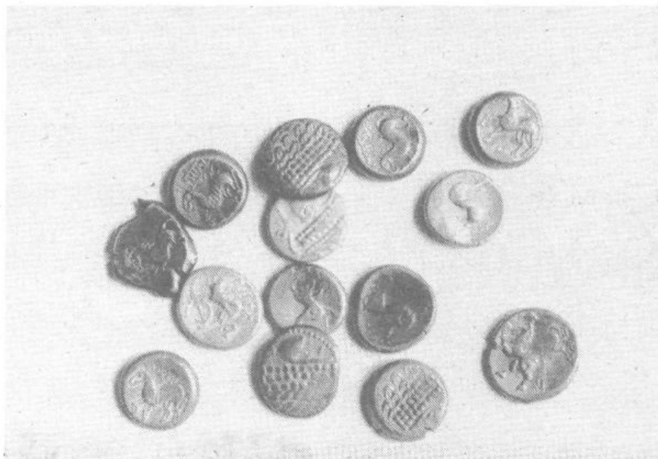
Kovanci iz najnovjših odkritij na barju

zavod za spomeniško varstvo Ljubljana, Republiški sekretariat za notranje zadeve, Društvo za podvodne raziskave Ljubljana ter PZE za arheo-