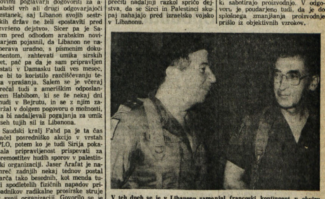
V teh dneh se je v Libanonu zamenjal francoski kontingent in okviru mednarodnih mirovnišnih sil, ki jih sestavljajo še čete ZDA, Velike Britanije in Italije...