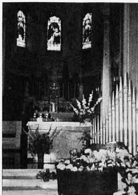
Letošnje jaslice v cerkvi v Bazovici