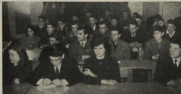
Delegati na izredni mladinski konferenci v Kočevju poslušajo poročilo