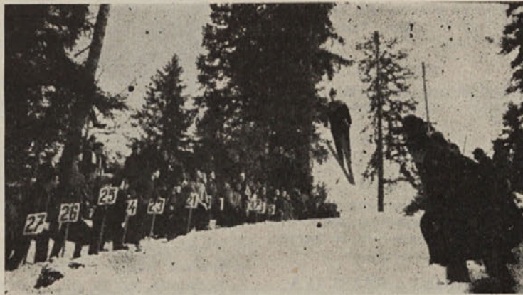
Z nedeljskega smučarskega tekmovanja v Ribnici

sneg ni bil ovira in so vsi tekmovalci izvajali lepe in dolge skoke. Razveseljivo je bilo, da je bilo izredno malo padcev in še ti so