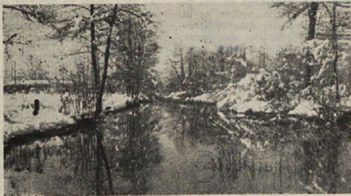
PREDVIDENE SO VELIKE POPLAVE — Odjuga je tu, snega pa tudi še dovolj. Ribničani so se pripravili na poplave — zgradili so NOETOVO BARKO