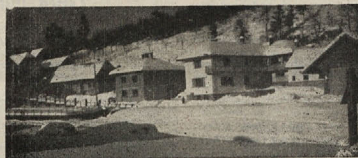
Sodražica pod snegom

opravili svoje, smo neuradno posedli v kotu pri Kaprolu, ki nam je postregel z odlično črnino in dobrimi pečenicami, potem ko jih je predpisanih dvajset minut