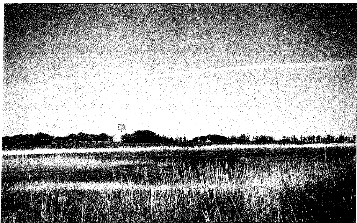
Sl. 3: Močvirja in resave zahodnega Jyllanda

Zakon vsebuje omejitve za ohranjanje območij naravne in kulturne krajine in zelo podrobno predpisuje, kako je treba ohranяти npr.: zidove in žive meje v krajini, izločiti dvometrski pas ob pomembnih objektih iz kmetijske rabe in stometrski pas iz zazidalne rabe, zagotoviti dostope za rekreacijo na zasebna zemljišča, urejati promet