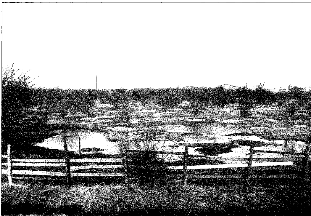
Sl. 2: Močvirni del območja Amarja, v neposredni bližini milijonskega mesta København

Med ledeno dobo je bila Danska od severa proti vzhodu večkrat pokrita z ledom. Tako danska krajina kaže sledi razvoja milijonov let, odkar je izginil led. Med tem obdobjem so se tla dvigala in pogrezala, kar je spreminjalo višino morske gladine. Morje, sveža voda in veter so odnašali in premikali material ter gradili nove nasipe. Sledove v celotni deželi pa je pustila človekova dejavnost v zadnjih 5000 letih. Zadnja poledenitev ni prekrila jugozahodne tretjine Danske. Na tem območju najdemo rastline, ki uspevajo v toplejših krajih, in morensko krajino, ki je nastajala v medledeni dobi v obliki otokov v taljeni vodi z ledenikov.