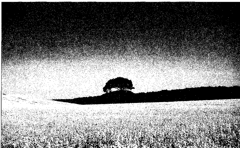
Sl. 4: Intenzivno obdelana kmetijska zemljišča, ki jih imenujejo "kmetijska puščava". Krajina je degradirana do takšne meje, da ne prepoznamo nobene značilnosti; prizor je lahko posnet kjerkoli v Evropi, a vse države, ki imajo takšna območja, katerih identiteta je izgubljena, si prizadevajo za njihovo sanacijo. Fig. 4: Farmland under intensive cultivation, known as agricultural "desert". The landscape has been degraded to such an extent that no characteristic feature has remained. It is a sight which could be located anywhere in Europe. In countries in which some areas have lost their identity efforts are made for their improvement.

Nadzor nad posegi v prostor je velik problem v Sloveniji, kjer zasledimo "črne gradnje" tudi v območjih naravne dediščine. Tudi na Danskem imajo območja naravne in kulturne dediščine velik rekreacijski potencial, vendar "črnih gradenj" ne poznajo. Danska je razvila sistem, v katerem so vsi posegi legalni. Kazni za kršitev so velike, finančne in moralne. Posebnih inšpekcijskih služb ni. Za vse prekrške je pristojna policija, o kršitvah pa obveščajo vsi prebivalci.