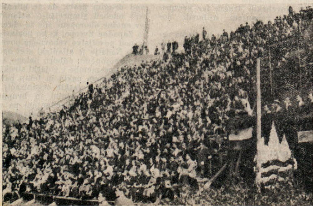
Del množice, ki se je udeležila koroškega festivala v Guštanju

Poročajo, da nameravajo s 1. novembrom podražiti cene v posamezni prodaji pri večini dunajskih dnevnikov. Cene naj bi poskočile od 40 na 60 grošev izvod. Povišanje cen je predvideno pri listih: „Wiener Zeitung“ (uradna), „Die Presse“ (neodvisna), „Neue Wiener Tageszeitung“ (OeVP) in „Neues Oesterreich“ (last obeh koalicijskih strank).