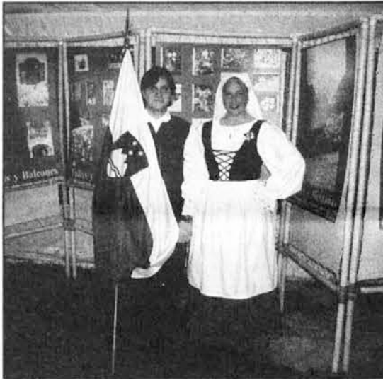
Slovenska predstavnica za kraljico festivala v slovenskem šotoru