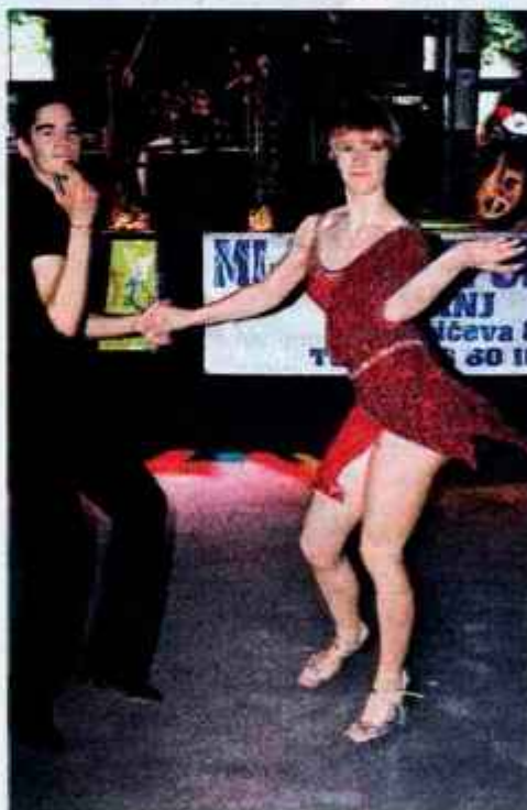
Na odrih bo poskrbljeno tudi za presenečenja... ...pridi in se prepričaj na lastne oči.

Pa letos? Program piknika se bo začel ob 16. uri, ko se bodo začele igre mladosti. Igre mladosti bodo podobne, kot se igrajo igre brez meja, ki jih poznamo s televizijskih ekranov. Vsako ekipo sestavlja pet članov, dva moška in dve ženski, ter rezervni igralec. Ekipe čakajo lepe nagrade. Prvih šest ekip bo šlo na izlet v Gardaland. Ostale pa čaka lepa tolažilna nagrada. Organizator prireditve že zbira prijave ekip za igre mladosti. Vse zainteresirane ekipe se lahko prijavijo na info točki ŠO FOV. Izberite si zanimivo ime in pričinite s koordinacijskimi pripravami, verjemite, potrebovali jih boste. Prijavite se in ne bo vam žal, saj vas čakajo bogate nagrade!