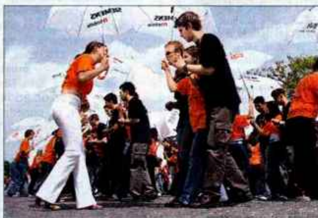
...nato pa skupaj z maturanti še dveh jeseniških in dveh radovljiških srednjih šol zaplesali rekordno četvorko.