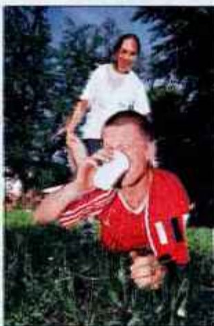
Igre mladosti so študentska različica Iger brez meja...