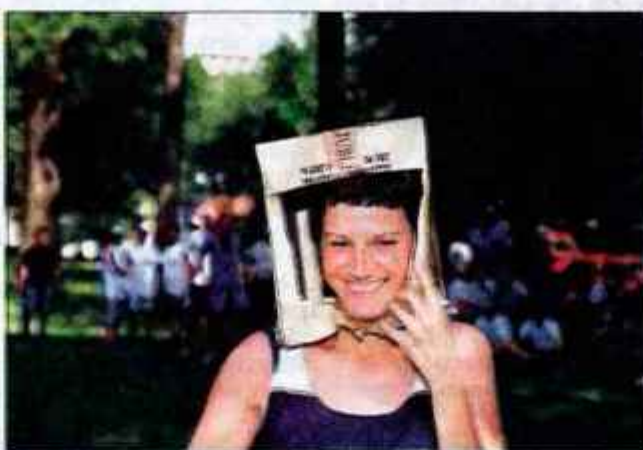
... na katerih je pomembno zabavati se.