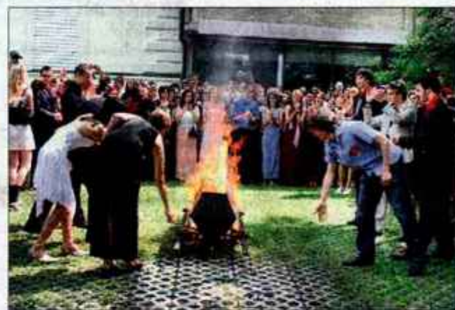
S sežigom krste so kranjski gimnazijci simbolično sežgali tudi štiri leta gimnazijskih muk.