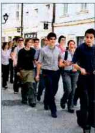
Kranjski maturanti so se najprej v sprevodu odpravili skozi Kranj...

Lani so po podatkih, ki so jih zbrali pri šolskem ministrstvu, šole organizirale in izvedle 1415 šol v naravi. Udeležilo se jih je 61.945 učencev. Vsaka šola je v povprečju izvedla 3,2 šole v naravi. Od tega je 27,4 odstotka izvedb šole v naravi vključevalo tečaj pletanja, 18,5 odstotka pa tečaj smučanja. V 42,2 odstotka je imel program šole v naravi poudarek na naravoslovnih vsebinah, v 2,4 odstotka pa na družboslovnih. Ob tem lani pet šol ni izvedlo niti ene šole v naravi. Nekatero osnovno šolo z manjšim številom učencev namreč izvedejo šole v naravi le vsako drugo leto zaradi racionalizacije tako pri organizaciji kot financiranju. Poleg tega se 13 odstotkov učencev, za katere so šole sicer organizirale šolo v naravi, zaradi različnih vzrokov te oblike dejavnosti ni udeležilo. M. R.