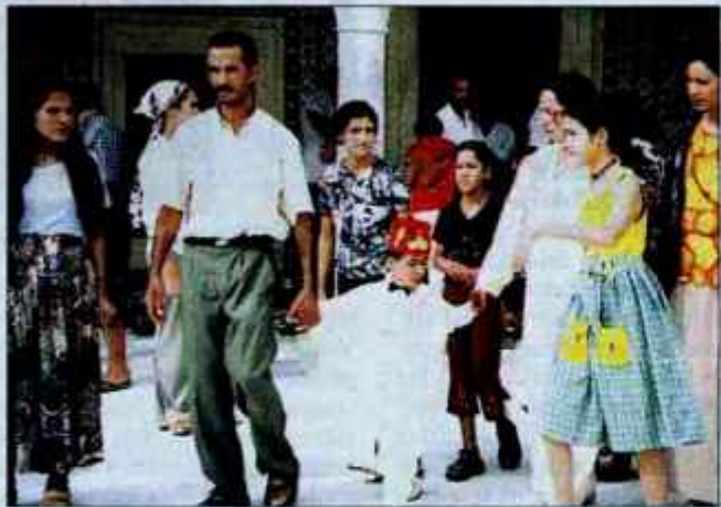
Pražnje oblečena muslimanska družina odhaja iz mošeje v tunizijskem svetem mestu Kairouan.

Vatikan v dokumentu ugotavlja, da so priseljenci znamenje časa in izziv za novo evangelizacijo, in svetuje, da je treba med njimi pastoralno delovati, še posebej, če so drugačne veroizpovedi. Katoličani morajo sprejeti prišleke odprtih rok in pokazati solidarnost v duhu Jezusovega usmiljenja in ljubezni, hkrati pa morajo biti pri porokah z nekristjani, še posebej katoličank z muslimani, zelo previdni. V Zahodni Evropi narašča število porok med muslimani in katoličankami. Otroci velikokrat odraščajo v muslimanskem okolju, še posebej, če oče musliman odpelje otroke v svojo domovino, kjer mati katoličanka običajno na vzgojo nima nobene vpliva več. Papeški svet za pastore priseljencev naroča,