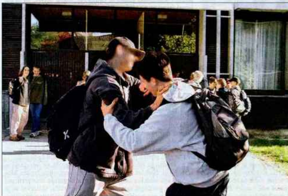
Kot najpogostejšo obliko nasilja učitelji doživljajo nemir v razredu.

tudi iz ankete, ki jo je med učitelji gorenjskih osnovnih in srednjih šol opravil kranjski območni odbor sindikata vzgoje in izobraževanja. Odzvala se je polovica šol, ki so jim poslali vprašalnike, in sicer štiri srednje šole, osem osnovnih šol, glasbena šola in vzgojno izobraževalni zavod. Med najpogostejšimi oblikami nasilja nad učitelji se pojavlja nemir med poukom, ki ga doživlja kar 90 odstotkov tistih, ki so odgovarjali na anketo, zelo pogosto je tudi verbalno nasilje, ko učitelje preklinjajo, zafrkavajo ali jim dajejo žaljive vzdevke. Manj pogosti so fizični napadi na učitelje s telesnimi poškodbami in spolno nadlegovanje, ki naj bi ju po mnenju anketiranih doživljalo 14 odstotkov učiteljev. Zlasti ob koncu šolskega leta pa se učitelji soočajo tudi z izsiljevanjem in šikaniranjem. Zelo zanimiv pa je razkorak, ko učitelji ocenjujejo nasilje v nji-