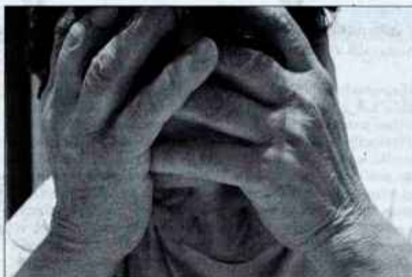
Glavobol je spremljajoč znak številnih bolezni in greni življenje kar 96 odstotkom ljudi.

Glavni problem je, da le okrog 40 odstotkov ljudi, ki trpijo za migreno, pride do zdravnika.