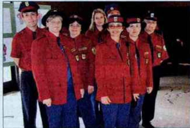
Slovenski občinski redarji so prepoznavni tudi po enotnih uniformah, ki so jih predstavili na slovesnosti v Bohinjski Bistrici.