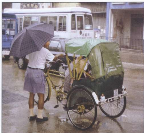
Slika 5: V Macauu se je deloma še ohranil tradicionalni javni prevoz z rikšami (foto: Matej Gabrovec).

Za razvoj turizma je pomembno ohranjanje kulturne dediščine. Zato so leta 1976 določili zavarovana območja in stavbe. Kot vzpodbudo za vzdrževanje zavarovanih stavb so njihovi lastniki deležni davčnih olajšav (3). V zadnjih letih je zaradi obsežnih gradbenih del vse pomembnejše gradbeništvo, med industrijskimi vejami pa je daleč najpomembnejša tekstilna industrija. Ob koncu osemdesetih let so bili glavni investitorji v macausko industrijo Hongkonžani, ki sta jih pritegnili poceni ne kvalificirana delovna sila in ugodne cene zemljišč (3). Industrija zaposluje petino macauske delovne sile (7), od tega polovico tekstilna industrija (6). Ob njej imajo vidnejšo vlogo še proizvodnja igrač ter elektronska in obutvena industrija. Kot povsod postajajo vse pomembnejše storitvene dejavnosti, ki so leta 1991 zaposlovale 57,7 % aktivnega prebivalstva (6).