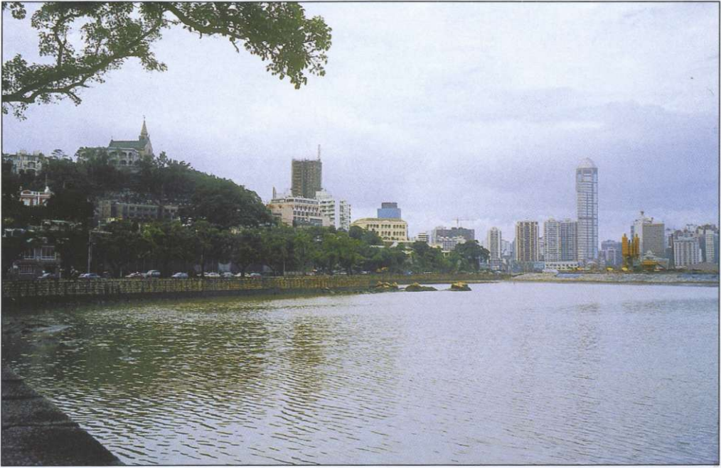
Slika 2: Stari Macau se razprostira po granitnih gričih, novi pa se širi na polderje.

sko, od koder so na Kitajsko pripeljali srebrnino. Pomembna je bila tudi okoliščina, da je bilo Japoncem pristajanje v kitajskih pristaniščih v tem času prepovedano. Portugalci so tako postali najpomembnejši trgovci z Japonsko in Kitajsko; v azijski trgovini so izpodrinili Arabce, drugih evropskih trgovcev pa takrat na tem območju še ni bilo (9).