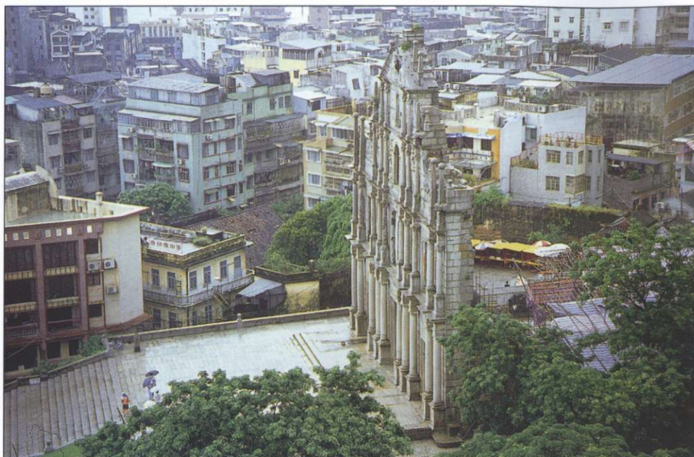
Slika 3: Katedrala svetega Pavla je bila v 17. stoletju najmogočnejša cerkvena stavba na Daljnem vzhodu, po požaru leta 1885 pa je ostala le fasada.

letja Kitajci pribežali v strahu pred vojnim pustošenjem in lakoto na severu države, leta 1930 so si tu poiskali zatočišče med kitajsko-japonsko vojno, med 2. svetovno vojno pa so se sem umaknili Evropejci iz Hongkonga, kajti Japonci so spoštovali portugalsko nevtralnost in Macau niso zasedli. Novi begunci so prišli leta 1949, ko so na Kitajskem prevzeli oblast komunisti, med letoma 1978 in 1980 pa so sem na čolnih pripluli številni vietnamski begunci. Do leta 1975 so dobili dovoljenje za bivanje v Macau vsi Kitajci, ki so uspeli doseči portugalsko ozemlje, četudi so tja priplavali. Šele po tem letu so jih obravnavali kot ilegalne priseljence (9).