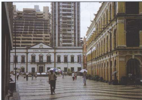
Slika 4: Za središče mesta je značilen splet portugalske baročne arhitekture in novih nebotičnikov.

Vse navedeno kaže na gospodarski razcvet Macaua v zadnjih dveh desetletjih, ki je povezan tudi s precejšnjimi državnimi naložbami. Najpomembnejša gospodarska dejavnost je turizem, ki temelji predvsem na igralništvu. Do leta 2001 ima izključno koncesijo za igralniško dejavnost družba Sociedade de Turismo e Diversões de Macau. Ta mora poleg posebnega igralniškega davka, ki znaša 31,8 % od neto prihodka, vplačati še 150 milijonov patak (pataka je macauska denarna enota; 1 pataka je bila po tečaju Banke Slovenije 1. 11. 1999 vredna 23,43 tolarjev, 1 ameriški dolar pa je približno 8 patak) v sklad za spodbujanje kulturnih, znanstvenih, vzgojnih, socialnih in dobredelnih programov, poravnati je moral polovico stroškov zidave kulturnega središča, 50 milijonov patak je prispeval v sklad socialnega zavarovanja, poleg tega pa je s prispevki sodeloval še pri raznih drugih javnih dejavnostih (7). Igralniški davek pomeni približno tretjino prihodka macauskega proračuna (6). Kot glavni igralniški gosti so prebivalci Hongkonga do leta 1990 predstavljali približno štiri petine vseh turistov (6), do leta 1997 pa je njihov delež nazadoval na dobrih 60 % (2).