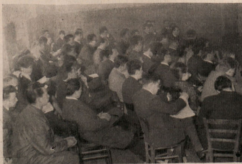
Udeleženci kongresa Mladinske iniciative v dvorani prosvetnega društva «Igo Gruden» v Nabrežini.

V nedeljo je bil v Nabrežini prvi kongres Mladinske iniciative. Kongresa se je udeležilo nad sto delegatov iz raznih krajev Tržaškega ozemlja in goriške pokrajine. Navzoči so bili tudi predstavniki Zveze komunistične mladine iz Trsta, federacije socialistične mladine iz Trsta, VK ljudske mladine Slove-