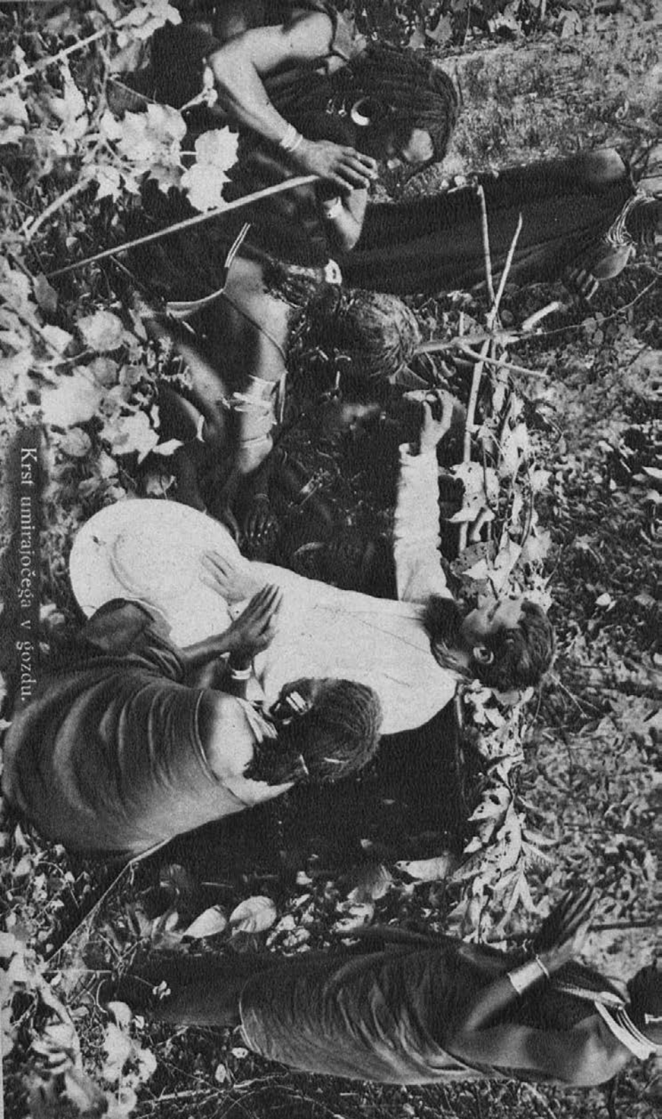
Krsti admirajočega v gozdu.