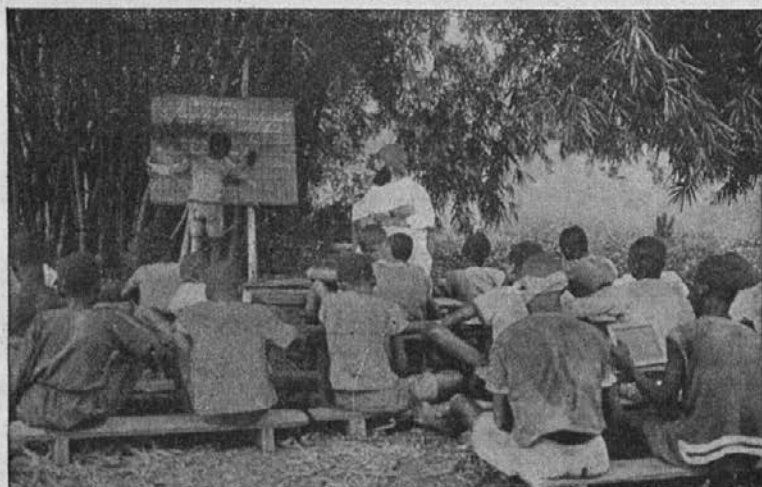
Zamorska šola na prostem (Belgijski Kongo).

V misijonih belgijskega Konga je bilo v teku zadnjih let otvorjenih več vaških šol. Poleg navadnega pouka se v teh šolah otroci, pa tudi odrasli, nauče temeljito zlasti verouka. Tako ti otroci potem znajo katekizem, še preden pridejo v misijon k pouku za prvo sv. obhajilo. Vsak dan