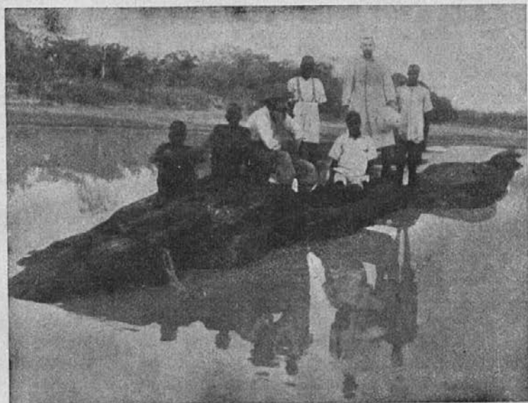
Misijonar s svojimi pridnimi zamorčki na malem otoku reke Nil.

sestri pri strežbi bolnikov. Nosil je bolnikom jedi iz kuhinje in po jedi zopet vse lepo pospravil in prinesel v kuhinjo. Takoj je videl, česa sestra potrebuje, in je vse takoj prinesel.