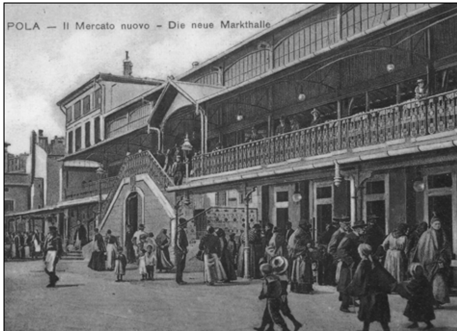
Sl. 3: Moderna puljska tržnica s početka 20. stoljeća.