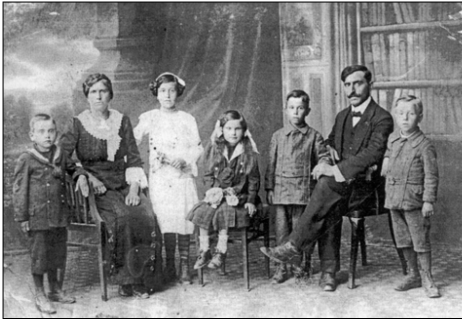
Sl. 1: Puljska obitelj početkom 20. stoljeća. Fig. 1: Family from Pula, beginning of the 20 th century.

postu muške i 46,5 posto ženske populacije nepismeno. Poseban pečat procesu iseljavanja stanovništva iz Istre dali su puljski i lošinjski kapetanat. Konačno, koliko je u razdoblju od 1890 do 1910. godine Istrana napustilo Istru i migriralo u Trst? Godine 1890. u Trst je otišlo 12.753 žitelja Istre najviše iz gradova Kopra, Voloskog i Poreča. U razdoblju doseljavanja rođeno je 9.221, dok je do 1910. u Trstu rođeno čak 20.285 djece prve generacije doseljenih Istrana (Hrvata, Slovenaca i Talijana) (Gombač, 1981, 116.). Glavni je razlog odlaska ruralnog življa u Trst i Pulu nepostojanje kapitalističke privrede i tržišta na istarskom selu istoga što je postojala mogućnost veće zarade i školovanja. U razdoblju velikih migracijskih procesa teško je pratiti točne razmjere i pravce ove pojave. Privremena, sezonska, povremena i stalna preseljenja iz sela u gradove tadašnja statistika nije precizno zabilježila. Istarsko stanovništvo nedvojbeno se kretalo unutar istarskog prostora (Gombač, 1981, 109–117; Naša sloga, 2). U razdoblju prve dekade XX. stoljeća bilježimo i veća prekorska iseljavanja u SAD i Argentinu. Broj Hrvata iz Istre do prvog svjetskog rata koji su emigrirali u SAD kreće se oko 25 tisuća (Laušić, 1990, 43). Socijalna struktura stanovništva Istre početkom XX. stoljeća vrlo se brzo mijenjala, posebice u većim istarskim urbanim središtima ali i u okolnim ruralnim zonama. Gospodarska zaostalost, za koju je vezana i ona društvena, osnovni je značaj Istre s početka XX.