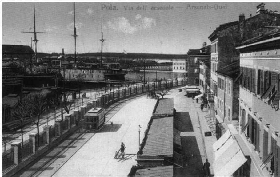
Sl. 4: Puljski tramvaj s početka 20. stoljeća. Fig. 4: Tramway in Pula, beginning of the 20 th century.

Jedan od najvažnijih čimbenika života u gradovima bili su uvjeti, odnosno mogućnosti stanovanja. Ovaj je problem posebice bio aktualan u vrijeme brzog širenja grada s kraja 19. i početka 20. stoljeća. Obitelji imućnijih građanskih slojeva živjele su poglavito u elitnijim dijelovima grada, komfornim, velikim i modernim stanovima ili vilama a djelomice i u samom gradu, iznad svojih poslovnih prostora. U psihološkom smislu dom, kuća, stan je jedina prava projekcija svijeta građanstva.