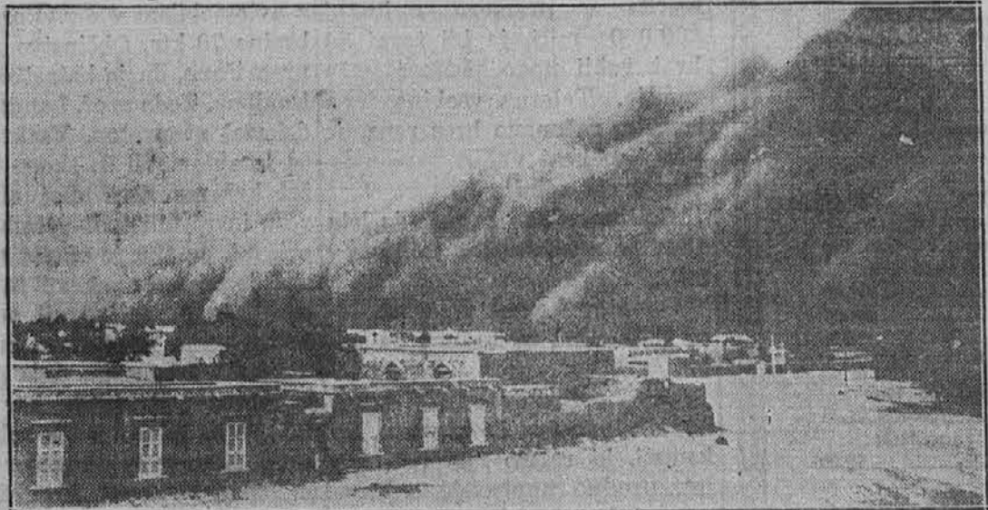
Slika kaže, kako silni vihar dviga cele oblake peska in prahu v okolici mesta Khar-tura, Indija. V teh okolicalah imajo poslopja vrlo nizka, iz vzroka pred varnosti pred silnimi viharji.