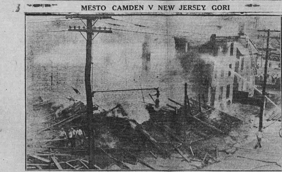
Pogled na uničujoče plamene, ki uničujejo mesto Camden, N.J. Ogenj je izbruhnil v lesnem skladišču.

z velikim pompom v soboto večer na zrakovoljni postaji, kjer ga je čakalo na deset tisoče ljudi. stva.