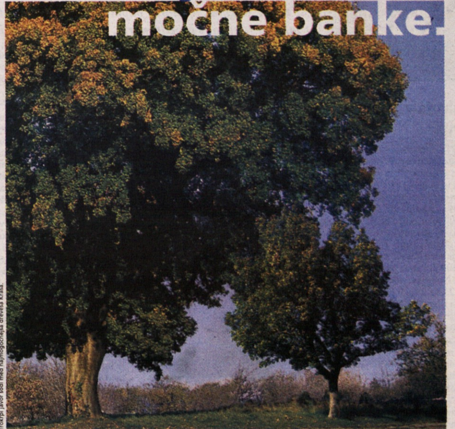
Trokrpi javor sodi med najmočnejša drevesa Krasi.