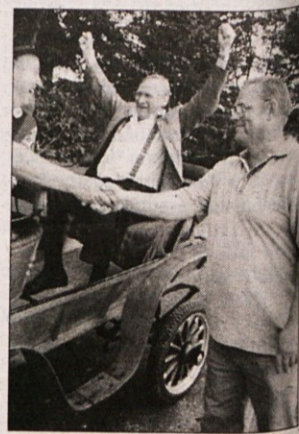
na vrh po novi cesti, in najbrž ni povezana z nastajanjem težko pričakovane mestne občine Krško.

MOST - Graditelji, ki so jih nedavno opazili na mostu čez Savo v Krškem, niso bili nadežja za meščane.