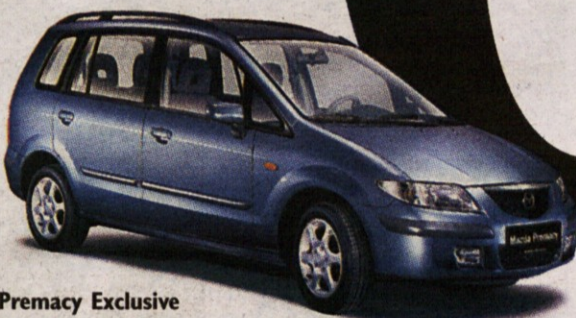
Premacy Exclusive 3.499.000 SIT