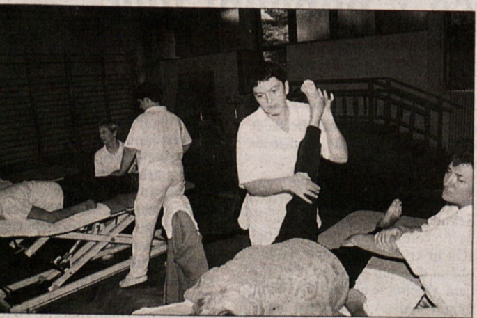
ČAS ZDRAVJA IN ČAS PO TEM - Kdaj je pravi čas za telovadbo? "Zmeraj", odgovarjajo tudi v zdravilišču Terme Čatež, od koder je slika. Tamkajšnje osebje meni, da je vse več Slovencev prepričanih enako in da je skrb za preventivno zdravljenje in obiskovanje zdravilišča vse več, čeprav nedvomno še premalo.