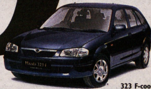
323 F-cool od 2.381.338 SIT

Nemogoče, boste rekli. Pa vendar je res: pri Mazdi vam ponujamo izjemno ugoden leasing, z 0-odstotno obrestno mero za avtomobile Demio 1,4i TE Cool, 323F-cool in Premacy Exclusive. Če pa ste se zagledali v kakšnega od drugih modelov, bomo tudi v tem primeru poskrbeli za naduse ugoden kredit in leasing. Še več: polog in rok odplačila bomo prilagodili vašim željam in potrebam, ves postopek pa boste opravili na enem mestu - pri vašem prodajalcu z vozili Mazda. Oglasite se!