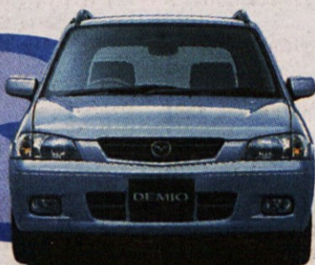
Demio 1,4i TE Cool 2.229.376 SIT

Primer izračuna*: za Demio 1,4i TE Cool 50 % polog - 1.114.688 SIT 50 % v 24 obrokih po 46.445 SIT Obresti vam podarimo