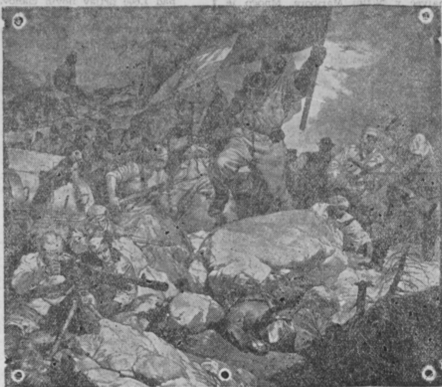
S. Pengov: Upor

Kakor vidimo, bo Zvezna ljudska skupščina zasedala, poslanci Zveznega sveta v njej pa se bodo lahko popolnoma posvetili poslanskim poslom. Poslanci Sveta proizvajalcev Zvezne ljudske skupščine bodo v nekoliko drugačnih položajih prav zaradi vloge Sveta proizvajalcev. Le-ta ne bo zasedal stalno, marveč samo po potrebi v primerih, predvidenih v ustavnem zakonu. Zato bodo poslanci Sveta proizvajalcev prihajali na skupščinska zasedanja v Beograd občasno. Za ta čas bodo imeli pravico do povračila vseh stroškov. Raven tega ustavnega zakona določa, da morajo biti poslanci Sveta proizvajalcev stalno zaposleni v proizvodnji. Izvzeti so samo sindikalni funkcionarji. Brž ko poslanec Sveta proizvajalcev trajno preneha delati v proizvodnji, preneha biti tudi ljudski poslanec.