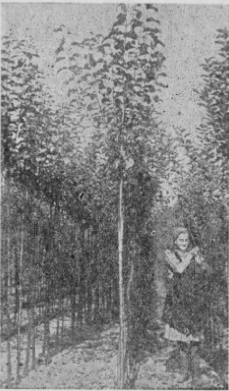
Drevesni nasadi v Št. Ilju

Sentiljsko drevničarstvo sega v prejšnje stoletje, ko sta bili znani dre-