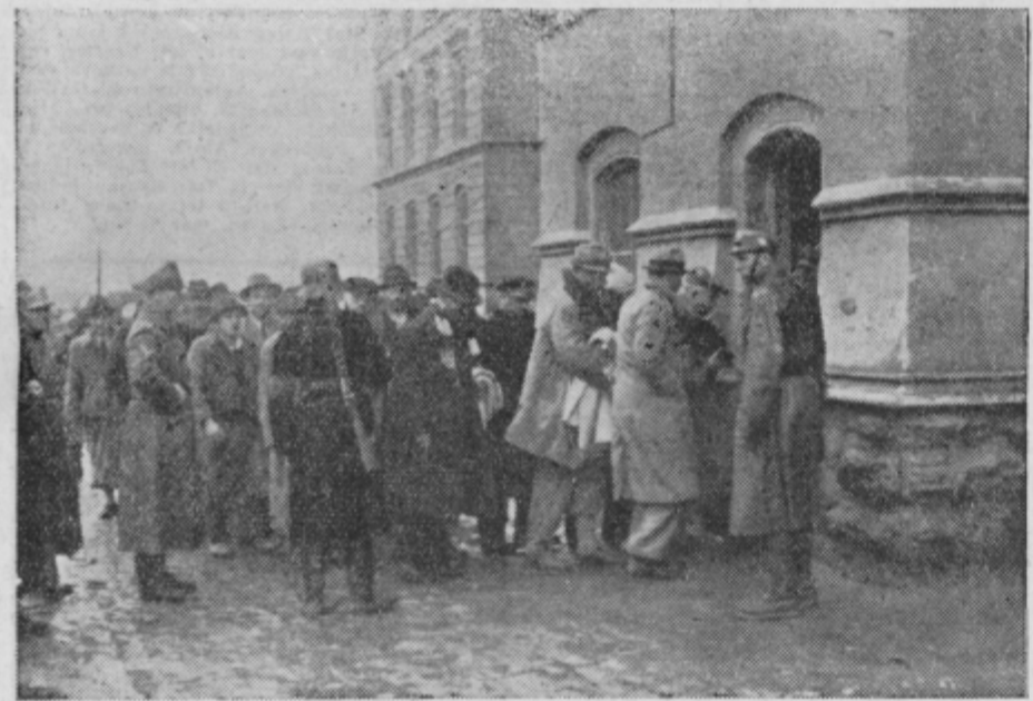
Takih prizorov Slovenci ne bomo nikoli pozabili

»Se bolj nenavadno je to, spoštovani abbe, da imava ob istem času močno podobne misli, le s to razliko, da so vaše precej skromnejše od mojih,« je odvrnil Voltaire s prijaznim glasom.