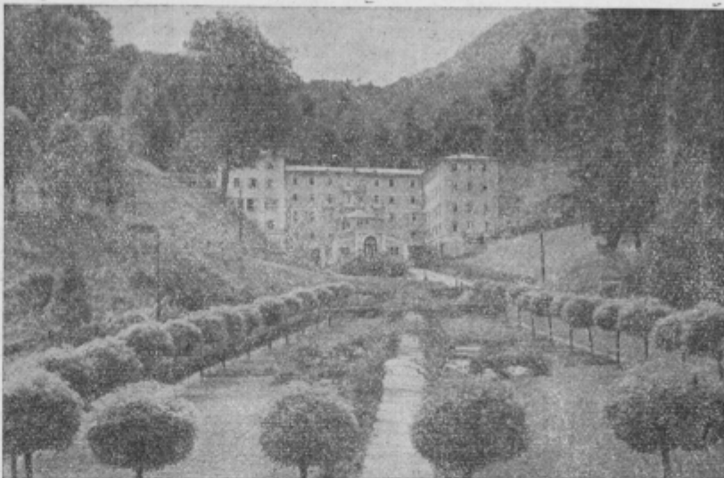
Nekoč zelo pomembno letovišče Rimske Toplice

Savinjski vestnik je 15. 8. t. l. objavil članek o visokih cenah Okrajnega gostinskega podjetja Rimske Toplice v tako imenovani »Stari pošti«. Kako je