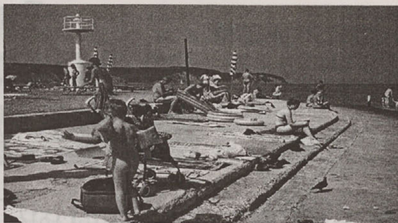
Delna bilanca turistične sezone