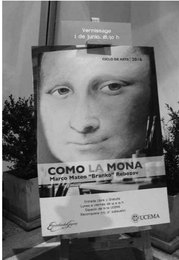
Ob vhodu na razstavo