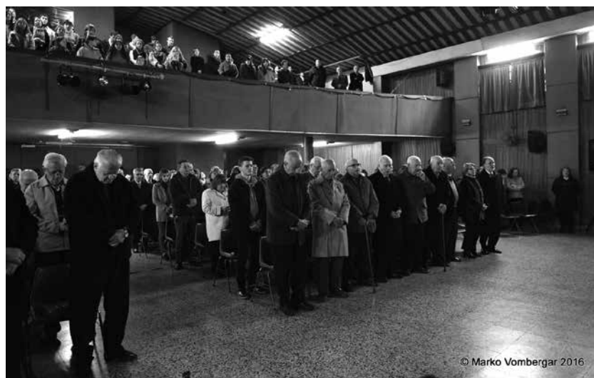
Med zaključno pesmijo »Oče, mati ...«

priča, kako je na tisoče in tisoče košatih, visokih in mladih dreves, ponos kraja in časa, bilo s silo posekano, padalo in umiralo. Njih les je bil steptan, razsekan in vržen v jame. Od kod ta prasila uničevanja? Gozd ne bo imel počitka ne konca. Šel bo med kamen in bor. Preobračal bo v sebi preteklost in prihodnost ter jima iskal