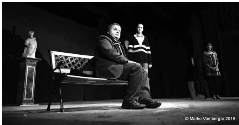
»Nihče ne more vedeti kdo je, če preje ne ve od kod prihaja.«