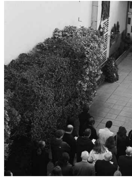
Poklon in molitev pred spomenikom.