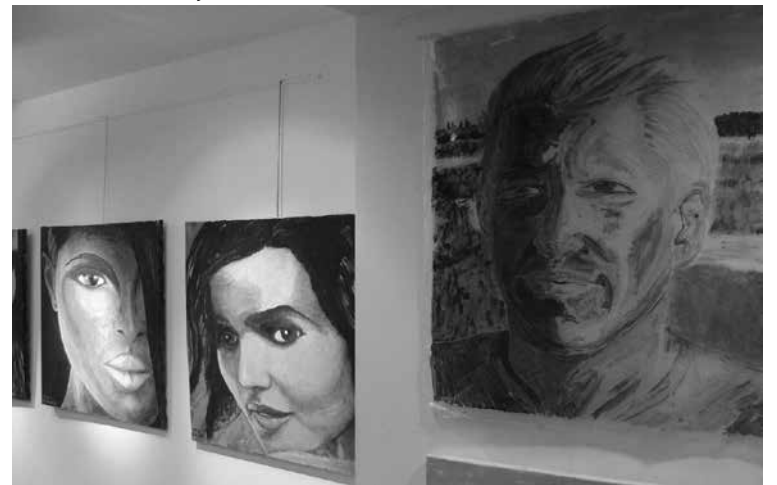
Samoportret in druge stvaritve

je bila le-ta ventil, da se je mogel odklopiti od sveta, v katerem se je poklicno udeleževal. Poznan in priznan kot ekonomist, je veliko delal kot tak, kot svetovalec in tudi kolumnist pri tukajšnjih in tujih listih in časopisih.