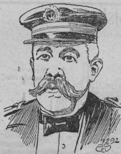
Admiral Peter Váchal

Redki slučaj, da postane Avstrijec admiral tuje mornarice, se je zdaj zgodil. Naša slika kaže visokega oficirja argentinske republike, ki je bil l. 1849 v avstrijskem mestu Taus rojen. Peter Váchal študiral je v Plznu, vstopil potem v Poli v c. k. mornarico, postal