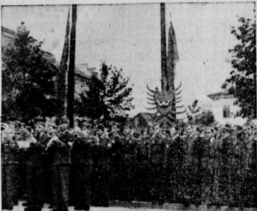
Unter den Klängen der deutschen Nationalhymne und der slowenischen Nationalhymne wurden beide Flaggen hochogezogen Ob zvokih nemške narodne in slovenske narodne himne sta bili dvignjeni na jamba nemška državna in slovenska narodna zastava