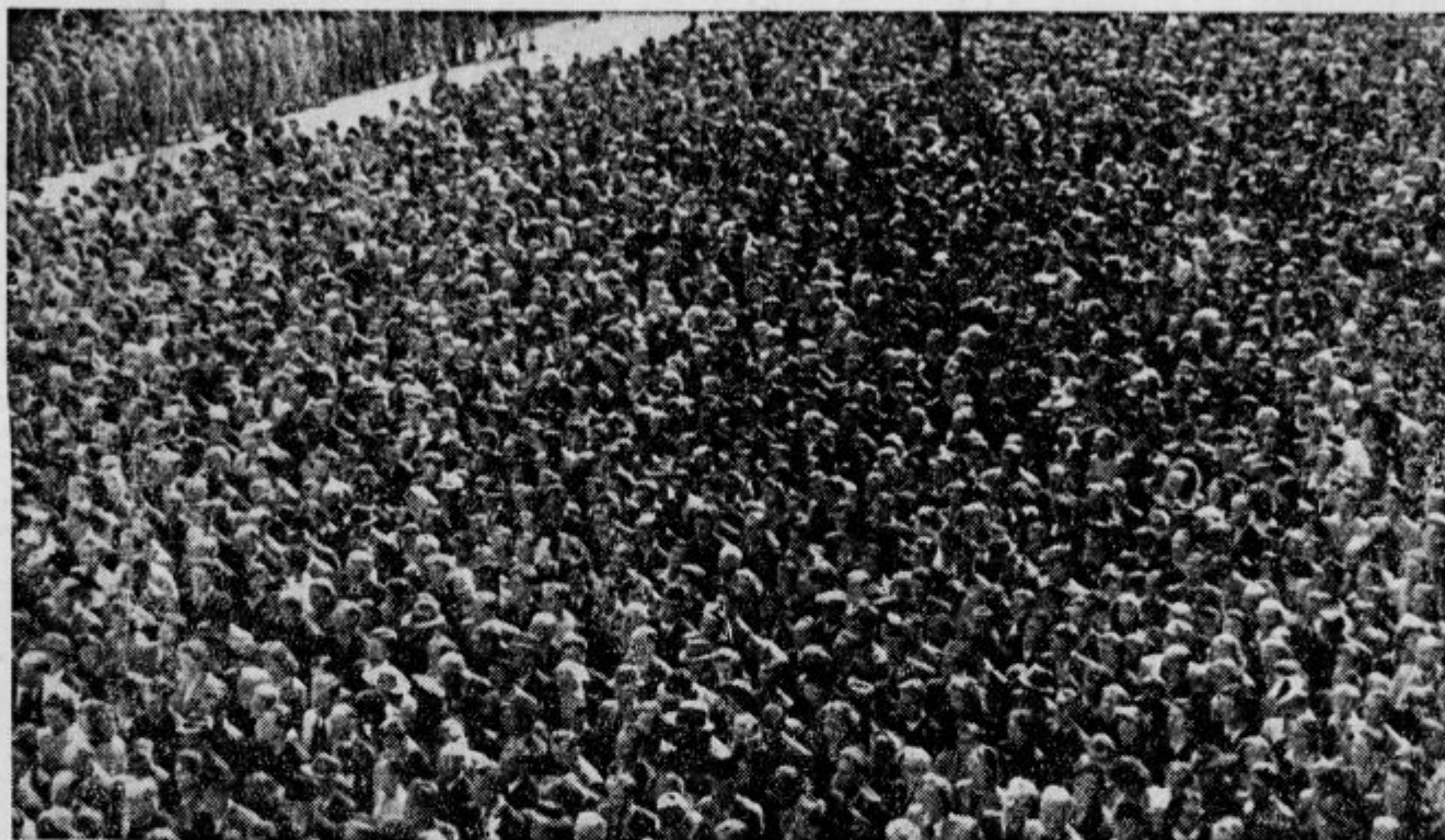
Kopf bei Kopf stand die 30.000 zählende Menge am Kongressplatz und lauschte den Ausführungen der Redner, die sie mit jubelnden Beifall begrüßte Mož pri možu je stalo na Kongresnem trgu 30.000 manifestantov, ki so pazljivo poslušali govornike in jih burno odobraval.

Če stopijo v totalnem bojnem in delovnem sodelovanju ali pa s svojimi prostovoljnimi borci in delavci v evropski obrambni fronti občudovanja vredni, hrabri Finci, potem Estonci, Letonci, Litvanci, Romuni, Madžari, Slovaki, Čehi, Bolgari, Srbi, Hrvati, Italijani, Spanci, Portugaleci, Francozi, Svicarji, Belgijci, Nizozemci, Danci, Norvežani in Švedsi, da, če se celo Rusi, Ukrajinci in kavkaški narodi množično in zelo hrabro bijejo proti boljševizmu in velebogataštvu, se moramo tudi mi Slovenci, ki bivamo na važnem prostoru naše zemlje, z vsemi sredstvi boriti in delati, da iztrebimo na vsem področju, kjer bivajo Slovenci, predvsem najpomembnejše in najbolj pošastno židovsko orožje — očitni in svetoblnski boljševizem, potem pa tudi njegovo zahodno zvrst gangsterstvo, — da tako rešimo svoj obstoj in svojo narodnost in postanemo — svojim naporom odgovarjajoče — deležni blagoslova zmage.