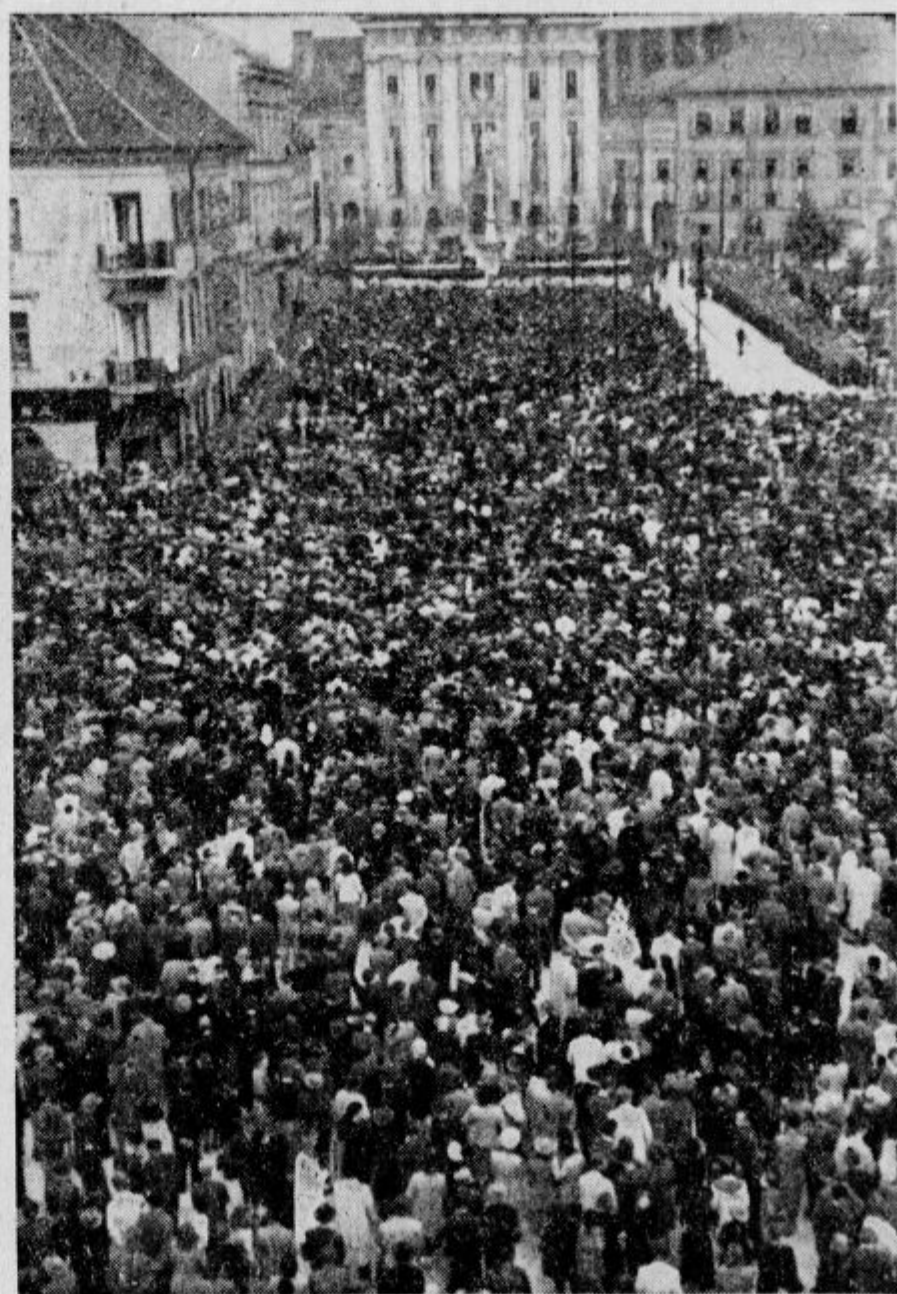
Die Massenkongregation der Bevölkerung gegen den Kommunismus in Laibach. — Protikomunistische Zuvorung des Prebivalstva na Kongressnem trgu

Barcelona, 29. junija. Po neki ameriški časopisni novici je de Gaulle podal oficijelno poročilo o svojem obisku v Londonu sovjetskemu poslaniku v Alžiru Bogomolovu. Na podlagi tega poročila bo naredil Bogomolov poročilo za Kremelj. Istočasno pa je Bogomolov izročil de Gaulleu Stalinovo povabilo, da bi prišel v Moskvo.