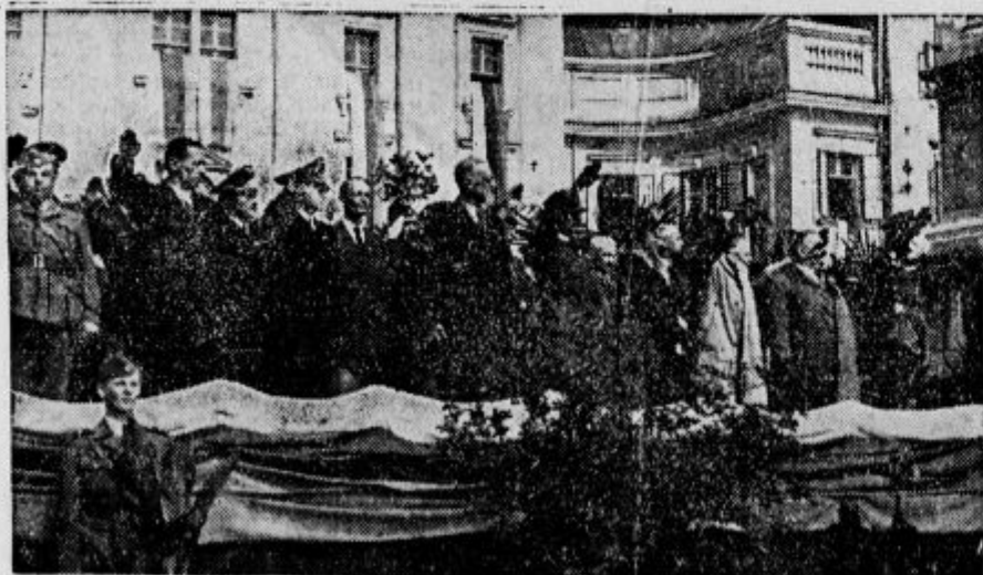
Auf der prächtig geschmückten Tribüne versammelten sich die Ehrengäste Na lepo ozaljšani tribuni so se zbrali častni gostje