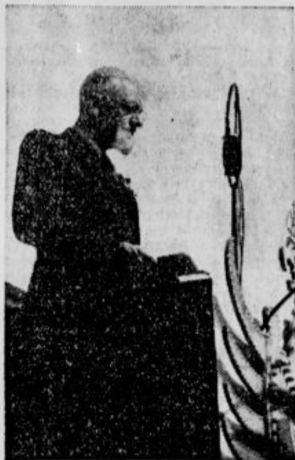
Der Präsident, General Leon Rupnik, hält die Ansprache Prezident, general Leon Rupnik, govori tisočem zborovalcem na Kongresnem trgu