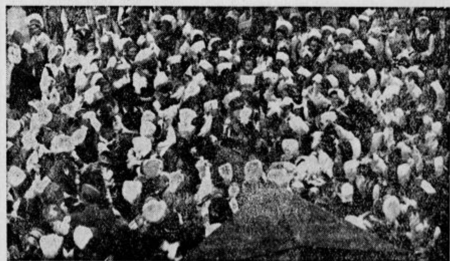
Am Schluss umringten die Manifestanten in slowenischen Nationaltrachten den Präsidenten. — Ob zaključku so narodne noše obkolile prezidenta.