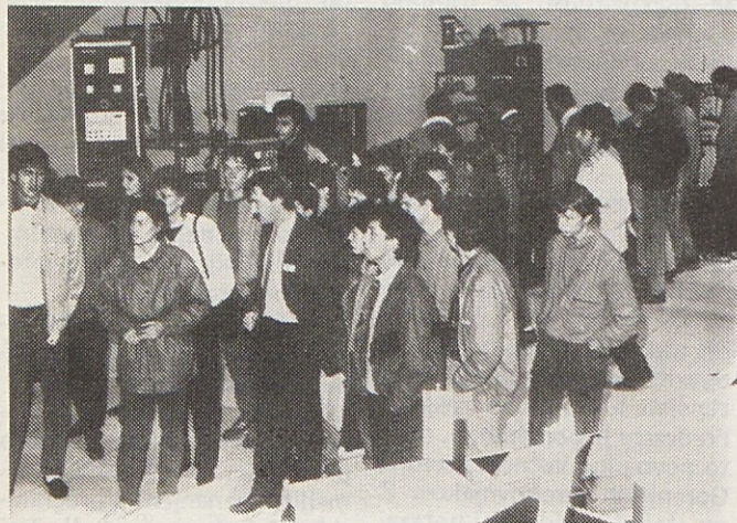
Hišni sejem je obiskalo 200 štípendistov Gorenja Gospodinjki aparatl.