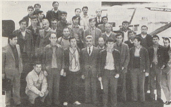
V petek in soboto je 35 delavcev Gorenja MIV iz Vranja obiskalo Gorenje in njegov hišni sejem. Hišni sejem je v soboto obiskalo tudi 15 najboljših proizvodnih delavcev Gorenja Bira iz Bihaća.