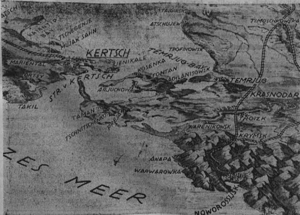
Tu je izkravavelo že mnogo sovjetskih divizij. Ob Kubanu poskušajo Sovjeti vedno nove napade.

Stockholm, 4. junija. Londonska poročila govore o silnem napadu odredov nemških bombnikov, ki je v torek popoldne meril na neko mesto na angleški jugovzhodni obali. Reuterjevo poročilo priznava znatne škode. Nadalje poroča londonski radio o nemškem zračnem napadu na London v torek dopoldne, ki ga je izvršilo več letal.