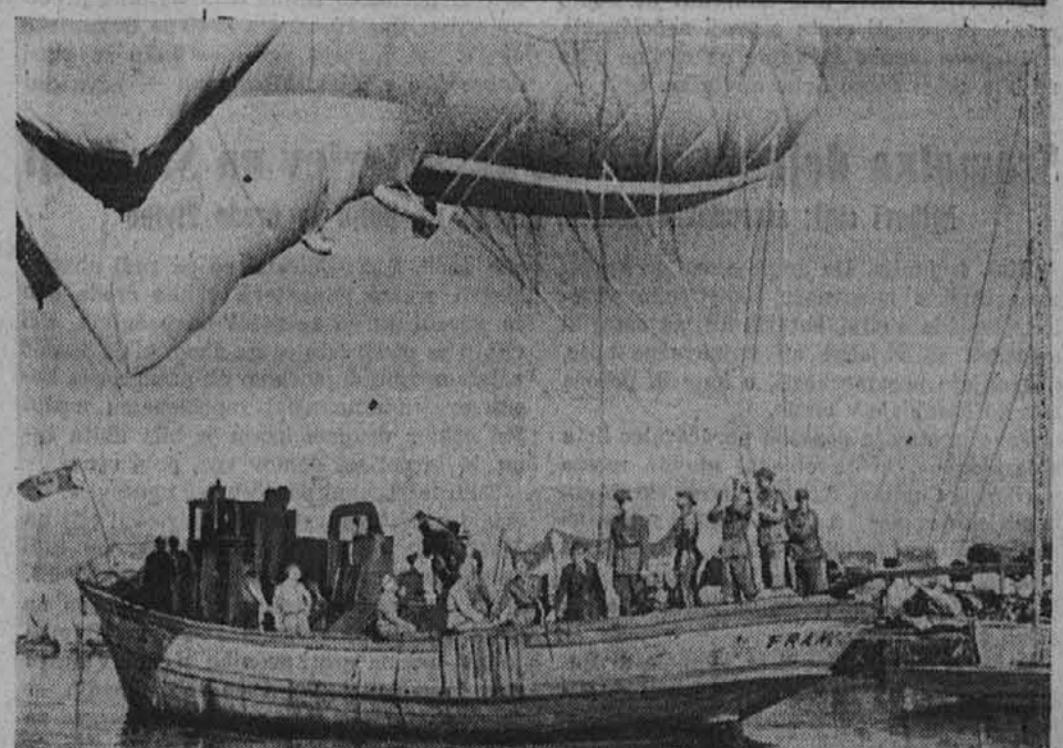
V neki italijanski sredozemski luki spusti protiletalska obramba v zrak privezni balon.