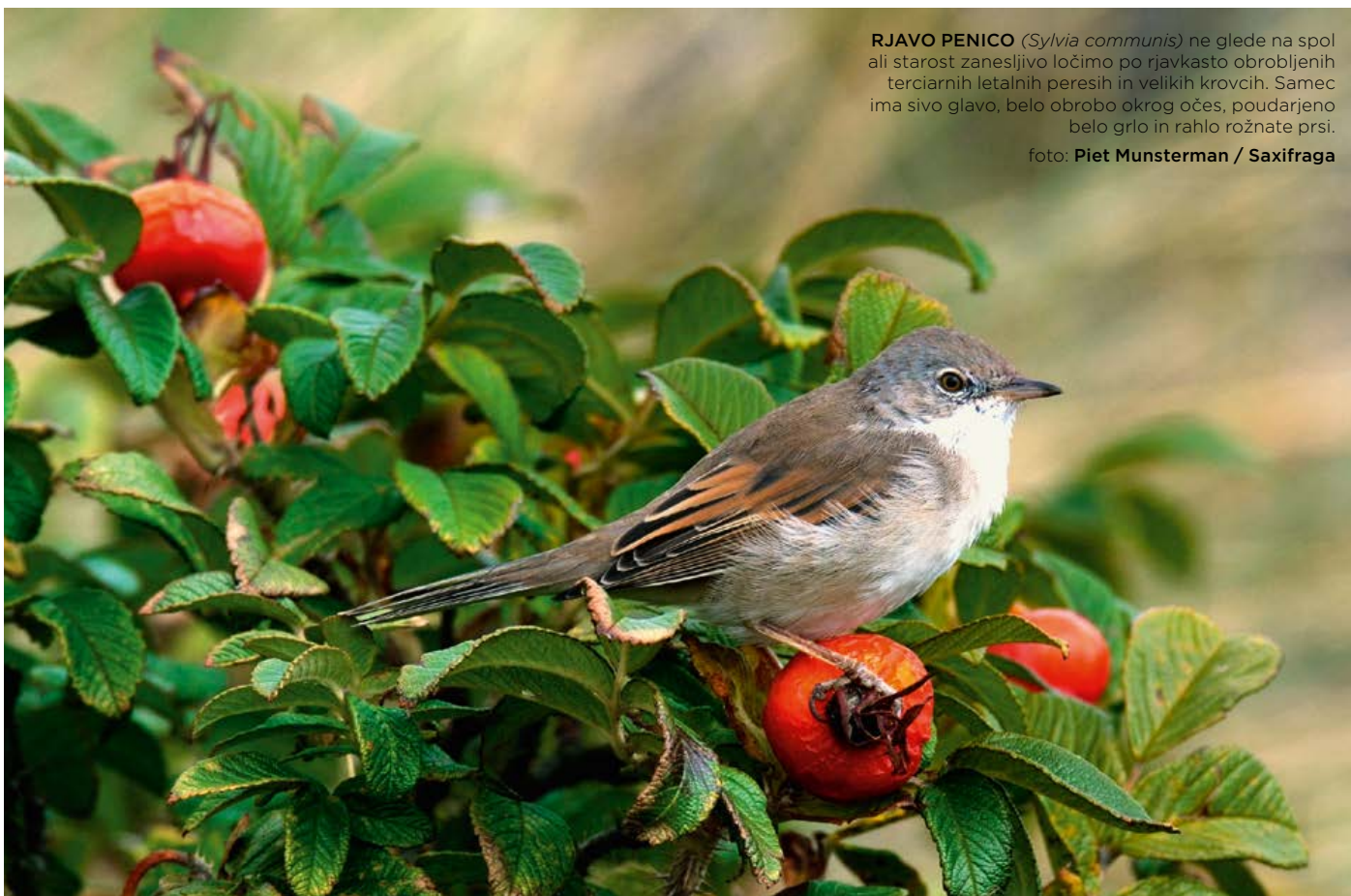
RJAVO PENICO ( Sylvia communis ) ne glede na spol ali starost zanesljivo ločimo po rjavkasto obrobljenih terciarnih letalnih peresih in velikih krovcih. Samec ima sivo glavo, belo obrobo okrog očes, poudarjeno belo grlo in rahlo rožnate prsi.