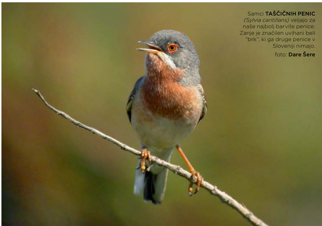
Samci TAŠČIČNIH PENIC ( Sylvia cantillans ) veljajo za naše najbolj barvite penice. Zanje je značilen uvihani beli "brk", ki ga druge penice v Sloveniji nimajo.