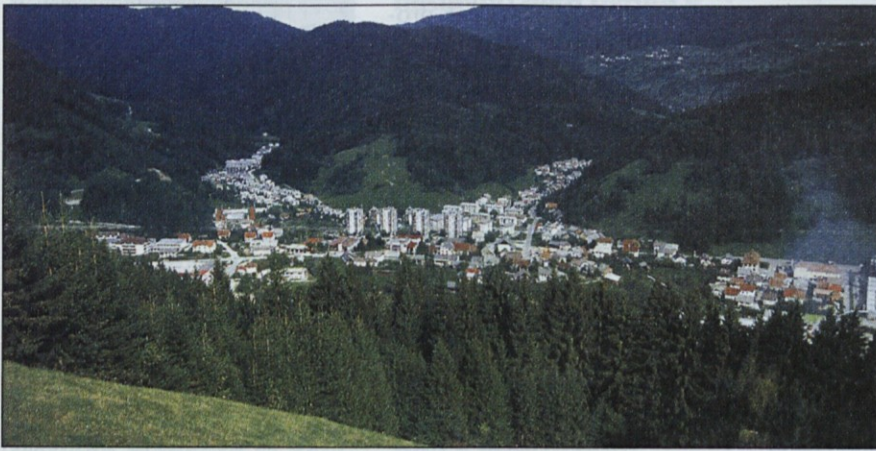
Panorama Železnikov, Toplarne Železniki in svečano rezanje traku v Gornjem Gradu.