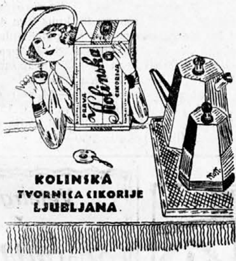
KOLINSKA TVORNICA CIKORIJE LJUBLJANA.

Omembe vredno odpornost kaže zunanja trgovina. V prvih devetih mesecih tekočega leta je znašal promet zunanje trgovine 3567 milijonov zlotov, za 773 milijonov zlotov manj kot lani v istih mesecih; izvoz je znašal 1846 milijonov zlotov, uvoz 1721 milijonov; torej je bila bilanca aktivna za 125 milijonov zlotov, dočim je bila lani pasivna s 354-4 milijoni. Ekspert je proti lanskiemu letu le malo padel, kar je razveseljivo znamenje za zmožnost poljske surovinske in fabrikatne industrije, da si varuje tudi v težavnih konkurenčnih razmerah svoje stalnice na eksportnem trgu, zlasti če upoštevamo preobremenitev poljskega blaga z davki, socialnimi dajatvami in mezdami. Neobhodno potrebno je znižanje produkcijskih stroškov , zato da se ohrani konkurenčna zmožnost na svetovnem trgu, kjer teče splošni baisse-val še kar naprej. Tej mednarodni prelevitvi se bosta prilagodila v prvi vrsti najbrž obe glavni poljski izhodni industriji, premog in železo . V septembru je eksport izkazan z 211-8 milijoni zlotov, import s 190-4, aktivnost trgovske bilance z 21-4 milijoni.