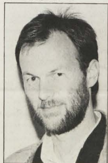
sliki: A. Kokot