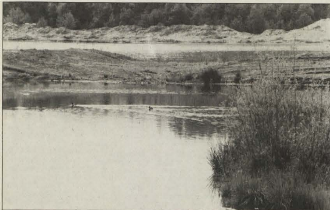
ÖDK, to so tudi nastajajoči biotopi, ki omogočajo naravno življenje.

Prodaj avto Ford Taunus 1600 (letnik 1975), zelo dobro ohranjen, preko zime stal v garaži. Podrobnejše informacije pod telefonsko številko 0 4237-2225 (dopoldne).