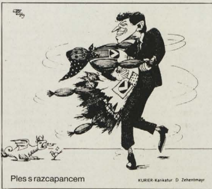
Ples s razcapancem