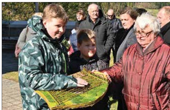
Babica z vnukoma ob citrah