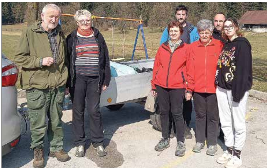
Udeleženci akcije so bili maloštevilni, zato je bil njihov trud še bolj hvale vreden.