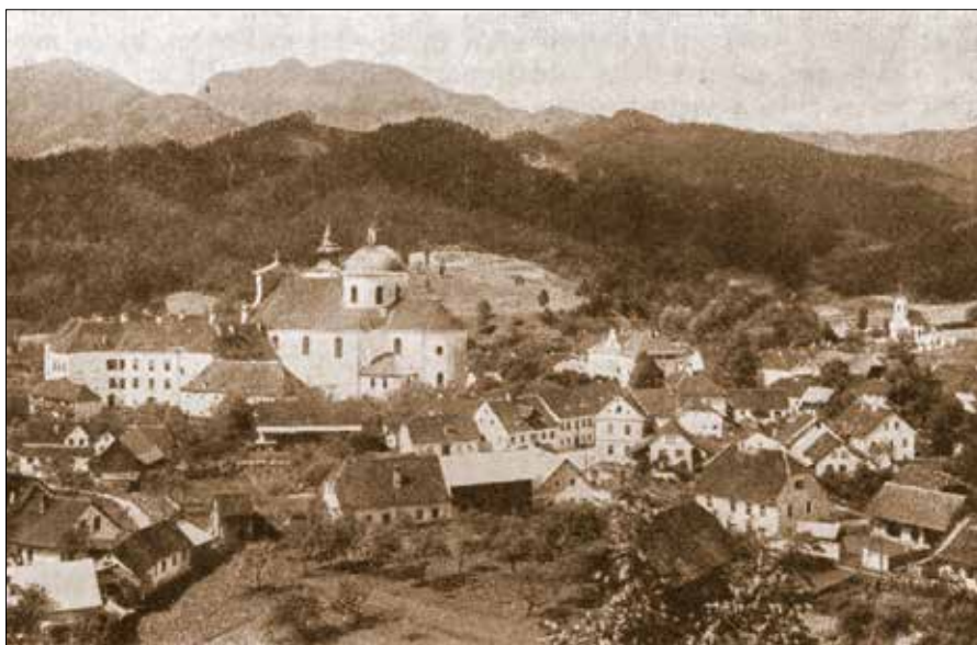
Gornji Grad z Rogatcem (Planinski vestnik 1933)

kim kosom črnega kruha. To nam je šlo v slast, bolj žejnim kot lačnim! In razgovarjali smo se z gospodinjo o domačih razmerah: kako težavno je tu kmetovati, ko se mora vse delo samotež opravljati. Potrebščine si morajo hoditi nakupovat ali v Gornji Grad ali v Luče po dve uri daleč. Otroci zaradi oddaljenosti ne morejo hoditi v šolo; kar doma jih bodo pozimi učili malo branja in pisanja. Tako je potožila mati s tremi otroki živega pogleda in rdečih lic. Bog ve, kakšni duševni talenti ostanejo tako za vedno zakopani in zatajeni. Značilno je, kaj je zbudilo nenadno pozornost te dece. Po kolovozu mimo hiše je konj pripeljal drvarski voz. »Konj, konj!« je deca vsa razigrana vzkliznila in planila iz sobe, da bi videla domačo žival, ki se v tej višini le malokdaj pojavi. Otroci v naših obcestnih vaseh pa se niti za avtomobile bog ve kaj ne zmenijo.