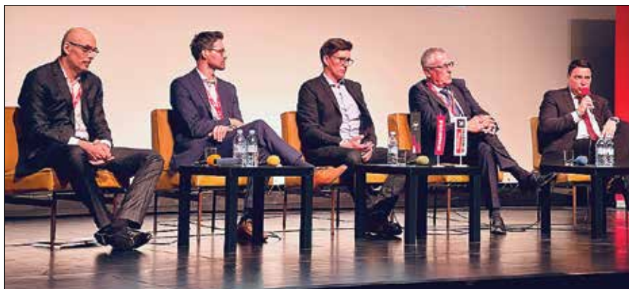
Na okrogli mizi so ugotavljali, kako naj poteka preobrazba Savinjsko-Šaleške regije.