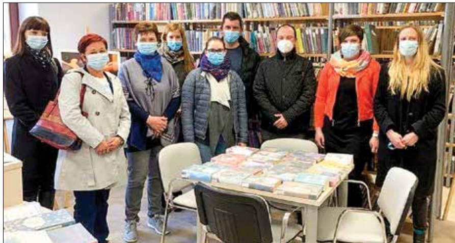
Predstavniki petih LAS-ov so se srečali na Ljubnem ob Savinji.