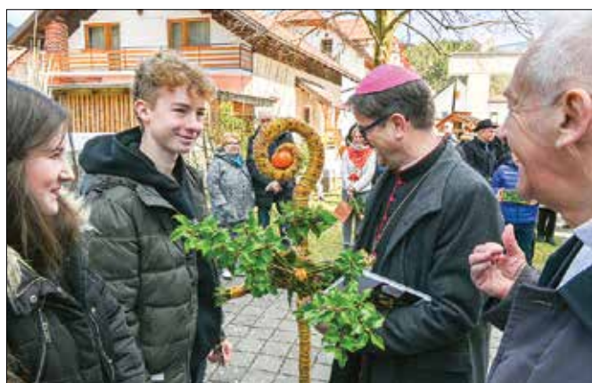
Fantova škofovska palica je bila vseč tudi celjskemu škofu.