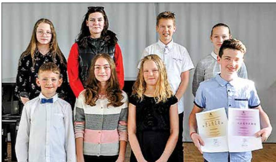
Učenci Glasbene šole Nazarje so se z državnega glasbenega tekmovanja vrnili bogatejši za priznanja in dragocene izkušnje.