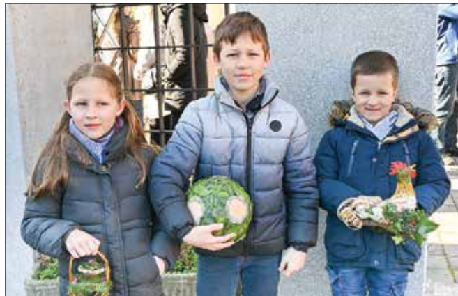
Tončevi otroci s cvetnonedeljskimi simboli