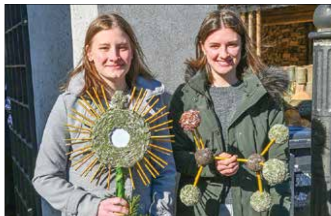
Sakralni simbol - monštranca in malo kemije na cvetno nedeljo