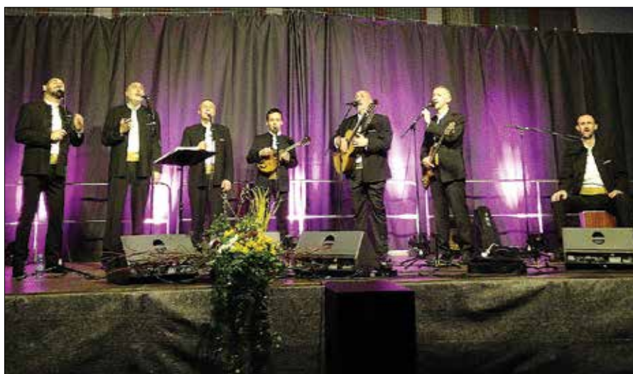
Rečičanom in drugim obiskovalcem so se tokrat predstavili člani klape Kampanel.