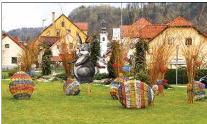
Velikonočno okrasje mimoidoče in mimovozeče prijazno opominja na prihajajoči praznik.