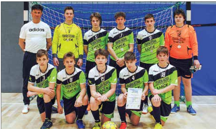
Nogometna ekipa OŠ Blaža Arniča Luče sedaj čaka nastop v državnem tekmovanju.