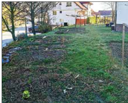
Stanovalci želijo obdržati vrtičke ob bloku.