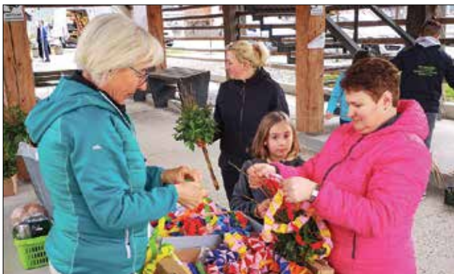
Organizirano ustvarjanje se že nekaj let izkazuje kot dobra praksa.