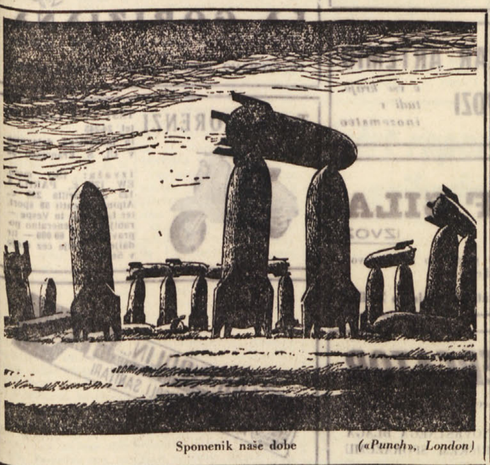
Spomenik naše dobe (Punch, London)

Kot vidimo, so se združili vsi nazadnjaški krogi, da bi preprečili sleherni politični in socialni napredek v državi, ki ga je začrtala republiška ustava. Pri nas pa je treba k temu splošnemu vsedravnemu položaju dodati še dejstvo, da se neče spoštovati ustavna določba o zaščiti narodnostnih manjšin (člen 6) niti splošna določba o pravih državljanih (člen 3).