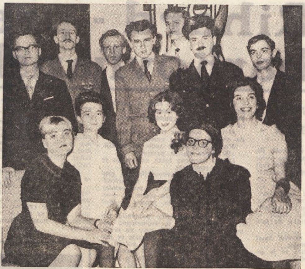
Dijaki Znanstvenega liceja, ki so nastopili v Anouilhovi «Antigoni»...