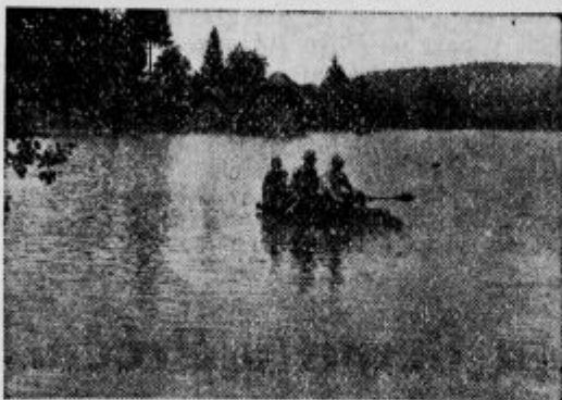
Podtabor pod vodo. Pogled od ene strani.