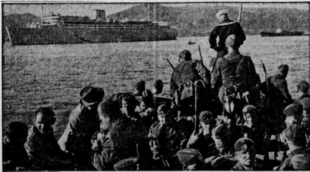
Nemški prostovoljci se ukreavajo za odhod iz Španije

Čungking, 1. junija. AA. Havas: Agencija Central News sporoča, da so Japonci v pokrajini Gornji Kijanski izvedli napad v treh smereh Kitajske čete so vse napade odbile. Japonske žrtve so zelo velike. Japonci so uporabljali v borbah strupene pline. V severnem Honanu kitajske čete napredujejo proti vzhodu. Ob reki Han v pokrajini Kopej se vodijo ogorčene borbe. V severnem delu omenjene pokrajine so Kitajci odbili japonske napade ter se Japonci umikajo.