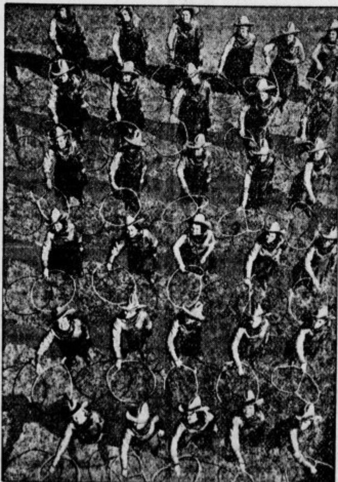
Vaje z laso so v skupini pri nekem nastopu izvajale dijakinje Hardin-Simmonove univerze v mestu Abilene (država Texas).

Ne vem, kakšne občutke imajo potniki, ki prihajajo iz Nemčije in prestopajo drž. mejo na Holmecu. Tik ob banovinski cesti, par korakov vstran od meje, je velikanski kup gnoja. Ob vročini roji po gnoju nebroj muh, in tudi »blagodejen« duh mora potnik vsrkavati. Zraven gnojišča je tudi šalsko poslopje; tako, da morajo razredi imeti okna zapeta. Res je, da se mora gnoj nekam skladati, ker je pač zraven hlev, vendar je na oni strani hleva več kot dovolj prostora za odpadke. Lastnik hleva, ki je inzemec, je bil že večkrat pozvan, da naj si gnojščice uredi, vendar se do sedaj še ni ničesar ukrenilo. Prosimo oblast, da to energično doseže, že zaradi šole in državne meje.