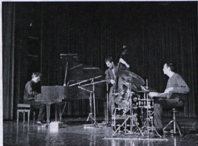
Gli "Standards" di Renato Chicco