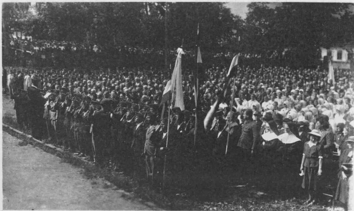
Obletnica »osvoboditve« Prekmurja v Dolnji Lendavi 16. aprila 1942

pa so bile tudi v Prekmurju. V začetku septembra 1944 sta bila soboški in lendavski okraj proglašena za vojno področje, kar je pomenilo predvsem zaostreno evidenco prebivalstva. Kmalu so se začele ukinjati tudi avtonomne pravice županij, mest, in vasi, vsa oblast pa se je združevala v rokah velikega župana oz. okrajnega nadglavarja, ki sta bila dolžna izpolnjevati naloge obrambnega ministristva. Oktobra 1944 je bil za novega predsednika vlade imenovan Ferenc Szalasi, ki se je 4. novembra 1944 proglasil za regenta ali »vodjo naroda«. Upravo v Prekmurju, ki je bila ponovno vojaška uprava, pa je prevzela t.i. Obmurska mejna obrambna skupina (Magyar kiralyi Muravidéki Hatarvedelmi Csoport), ki je obsegala področje Prekmurja in Medžimurja. 21