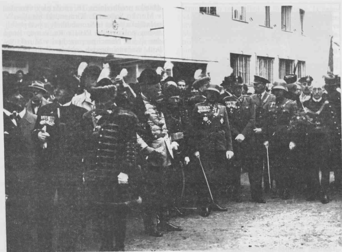
Proslava »osvoboditve« Prekmurja v Murski Soboti 29. februarja 1941

administrativno razdelitev Madžarske, tako, da so se ozemeljsko razširile posamezne županije, razdelitev okrajev in notariatsov v njih pa je do uvedbe civilne uprave prevzel minister za notranje zadeve. Po razdelitvi je lendavski okraj svoj sedež iz Lentija ponovno prenesel v Dolnjo Lendavo, soboški in monoštrski okraj, ki sta bila po prvi svetovni vojni združena, pa sta bila ponovno razdeljena na dva okraja s sedežema v Murski Soboti in v Monoštru. Prvi okraj je spadal v županijo Zala, ostala dva pa v Železno županijo.