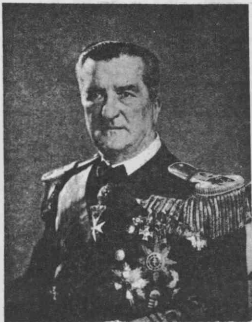
Vitéz nagybányai HORTHY MIKLÓS Vogorszoga országa ravnitel.