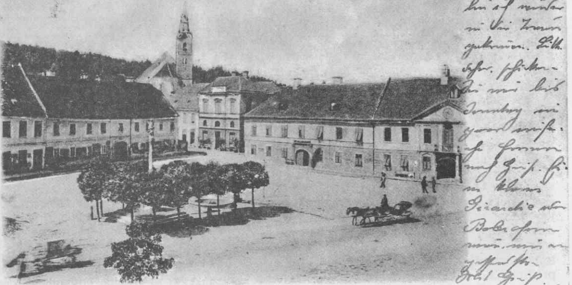
Ljutomer, Glavni trg (južno-zahodna stran)

Zalozil Alfo Huber, Fotograf, bukvarna v Ljutomeru