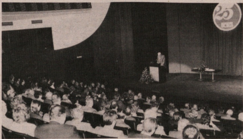
S sinočne slovesnosti v Kulturnem domu

Slovesnost je sklenil Tržaški oktet s petimi pesmimi, ki so simbolično ponazorile zgodovino slovenskega človeka na naših tleh. (vb)