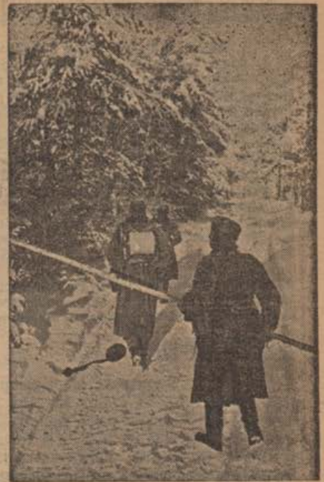
Nachrichtentrupp zieht eine neue Leitung zum Gefechtsstand in den Waldal-Höhen. — PK.-Aufnahme: Kriegsberichter Etzold. (Wb.)

Als der Beamte den Hund gewaltsam von seinem Opfer losreißen wollte, biß ihn dieser in blinder Wut in die Hand, die stark blutete. Der Polizeibeamte aber, der glaubte, das Tier sei tollwütig geworden, streckte es mit einem wohlgezielten Schuß aus seiner Pistole nieder. Der letzte Blick voll Schmerz und Anklage galt seinem Herrn, dem er doch das Leben gerettet hatte und dessen Tun ihm unverständlich schien.