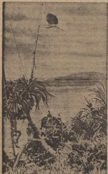
Zum Kriegsschauplatz in Ostasien, japanische Truppen landen in einer feindlichen Bucht.

Über die verschneiten Flächen fliegen die Staffeln ostwärts zu einem weit vorgeschobenen Feldflugplatz, der den Infanteristen gleichzeitig als Sammelplatz gilt.