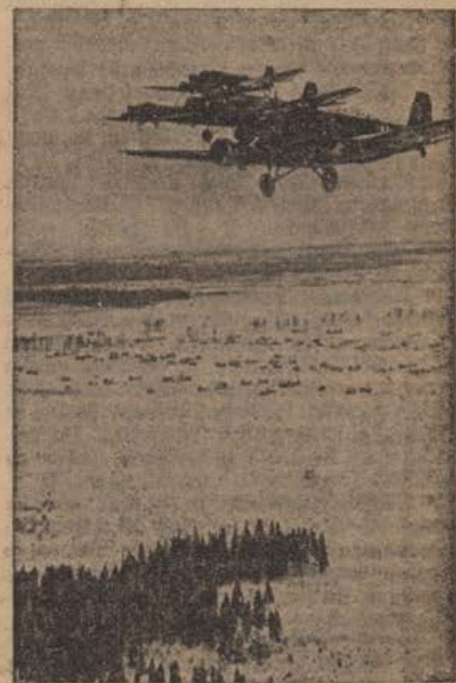
Wintereinsatz einer Transportstaffel im Osten.

Italijanski veleposlanik pri Sv. stolici umrl. V Rimu je umrl veleposlanik Attolico, ki je zastopal Italijo pri Vatikanu, v 63. letu svoje starosti. Pokojni Attolico je bil med drugim višji komisar Društva narodov v Danzigu, podtajnik Lige Narodov, italijanski veleposlanik v Rio de Janeiro, Moskvi in Berlinu. Naposled je bil imenovan za ambasadorja pri Vatikanu. Pokojnik je veliko pripomogel k utrditvi in poglobitvi nemško-italijanskih odnosov.