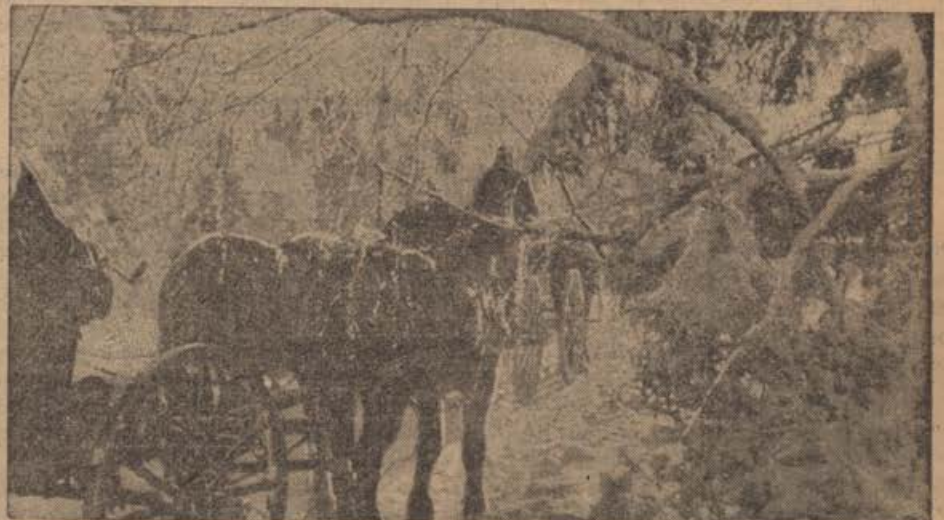
Durch den verschneiten Winterwald Nachschubkolonnen beim Marsch durch die verschneiten Wälder der Waldaitöhen.

Prav tako neženirano je Cripps pojasnil tudi izdajalske vojne priprave