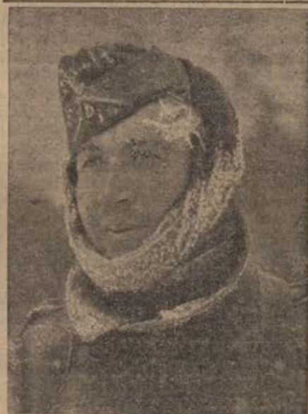
Mit Rauhreif überzogen, Ein Fahrer, der mit seinem Gespann mehrere Stunden unterwegs war.

□ Reitnig. V skupnosti je moč, skupnost je nezlomljiva in ustvarjajoča. Temu dokaz so občudovani uspehi naše vojske na frontah; so te armade kakor en mož, z enim ciljem ter enim delom: ohraniti svojo domovino ter ustvariti človeštvu boljše in pravičnejšo bodočnost. In mi doma, bomo li ostali malomarni, zroč topo, kako naši junaki na frontah krvavijo in prezebajo v letošnji hudi zimi? Sramotno bi bilo in ne-čredno, nič storiti in podpreti po naših močeh te cilje, ki ne morejo biti nikomur brez zanimanja. Primimo torej tudi mi za orožje, katero ni male važnosti, primimo z veseljem in ljubeznijo predvsem za motiko in plug, ko nastopi pomlad, da bomo izsilili iz zemlje čim največ kruha. S tem ne bomo koristili samo sebi, nego podpri bomo s tem skupnost, kajti kruh in prehrana je silno važno vprašanje. Zato pa bodi naša skrb, obsejati ter posaditi na spomlad vsak količnik primeren košček zemlje, da bomo pridelali čim največ živeža. Lotimo se tega torej predvsem z ljubeznijo ne zgolj do naše rodne zemlje, nego imejno v vidu brez vsakega pomisleka tudi našo skupnost. Kar se je nemara dosihmal opravljalo na polju bolj malobrižno, naj se dodela sedaj s podvojeno nego, uspehi bodo dokaz, da se je v prošlih letih marsikje gospodarilo res malomarno. Gospodar, pregledj sam, kako orje ali brana njivo tvoj hlapec, ali jo opleva dekla, še posebno je treba tvojega očesa tam, kjer delajo to