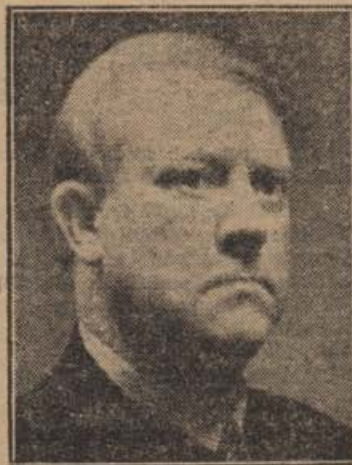
Quisling zum Ministerpräsidenten Norwegens ausgerufen.

o. Največje število las imajo svetlolase ženske. Znanstveniki, ki so šteli in računali, koliko las ima človek na glavi, so prišli do sledečih števil: Svetlolasa ženska ima 140.000 las, temnolasa 120.000, izrecna črnka pa samo 100.000. Najmanj las pa posedujejo rdečelase glave in sicer samo 88.000.