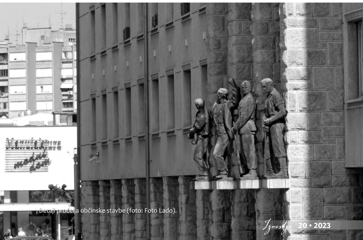
Detajl pročelja občinske stavbe.