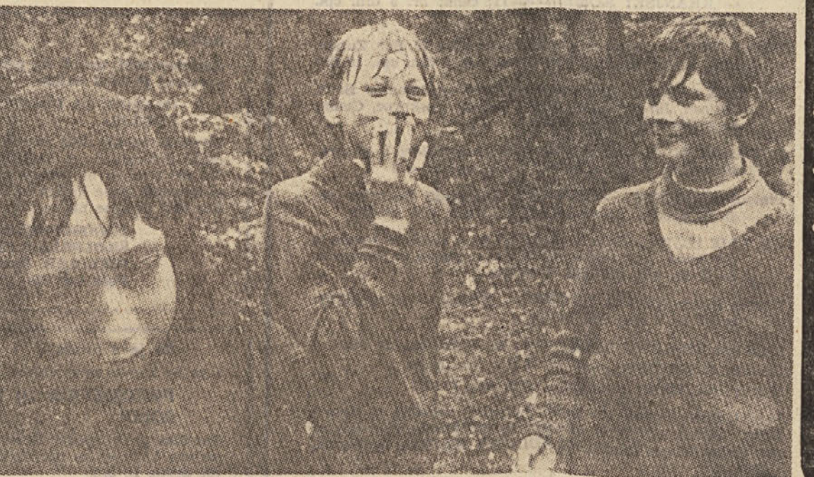
Solska socialna služba je lahko v pomoč tudi Tajništvu za notranje zadeve pa tudi sodišču...

Pozornost je temelj vsake miselne dejavnosti. Izbral: VIATOR