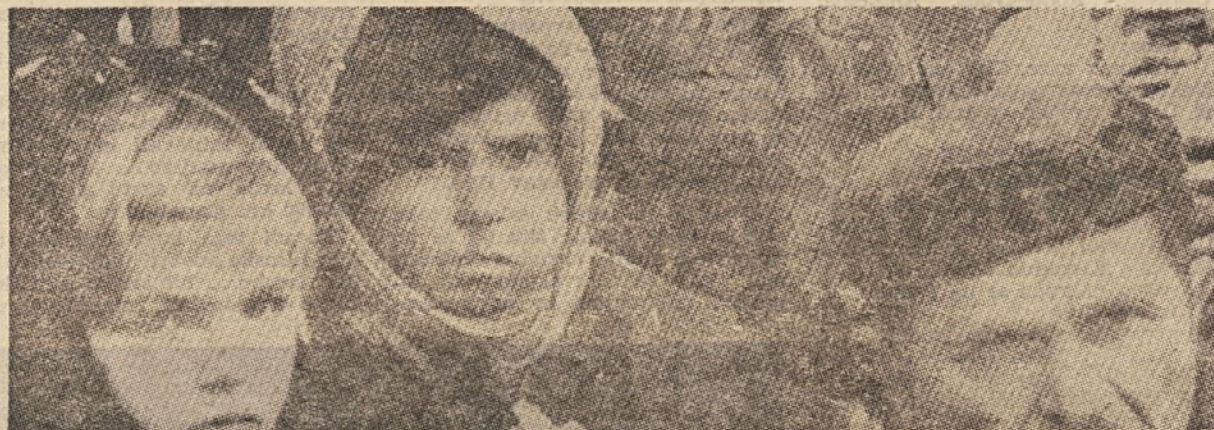
Prizor iz filma Bitka na Neretu

Kakor je dom tisti, ki denarno omogoča ogled filmov, in šola tista, ki naj se trudi pri filmskovzgojnem delu, pa je priložnost tista, ki nudi vsakomur, da si ogleda vsakršne predstave. Če bi bila filmska poli-