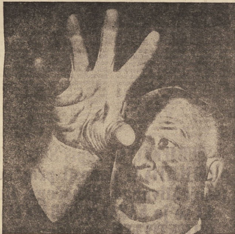
Slavni Hitchcock, režiser filmskih grozljivk...