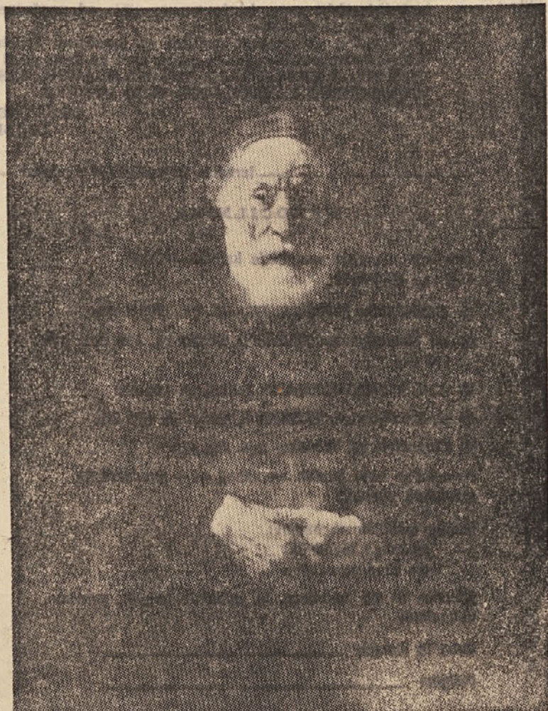
Rembrandt: Portret starčka v rdečem (okrog leta 1652—1654); iz leningrajskega Ermitaža

Kandidati naj pismene ponudbe z dokazili o izpolnjevanju razpisnih pogojev dostavijo komisiji za volitve in imenovanja Skupščine občine Žalec v 15 dneh po objavi razpisa.