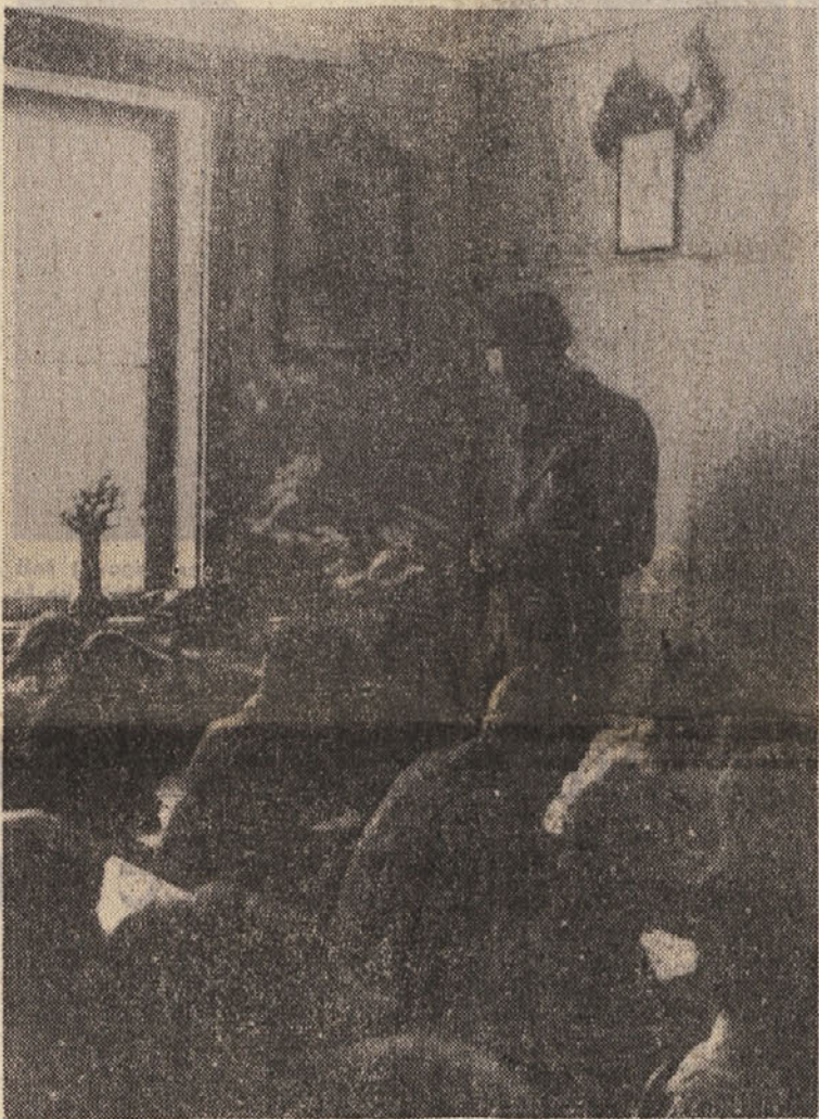
V partizanski šoli na Martinjvrhu leta 1944: še danes ni znano, kdo je učitelj na sliki...

predvsem kot vzgojne in šole nato kot varstvene. Pri reševanju kadrovskega vprašanja pa je potreben večji posluš lokalnih faktorjev (učitelji ne morejo biti brez stanovanj!). Problematika dvojezičnega šolstva ima seveda na obali spet svojo specifično, ki jo zajema že tudi ta sondažna analiza, naslednja pa jo bo še bolj osvetlila. Delo, ki teče od oktobra lani, že rojeva jasna spoznanja in šele tako je zajamčena uspešnost sanacije. Zagore