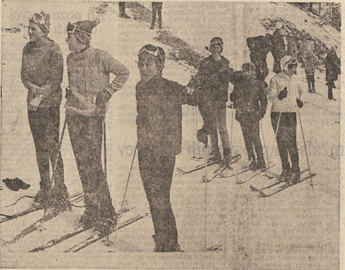
Prvo veliko srečanje pionirjev iz vse Jugoslavije — zimske športne igre v Celju in na Golteh 28. 2. in 1. 3. — so bile vrhunce Jugoslovanskih pionirskih iger 1970. Vsestransko uspela prireditelj je nudila mladini priložnost za plemenita tekmovanja v drsanju, v sankanju, orientacijskem teku, smučarskih skokih, hitrostnem drsanju, smučanju in hokeju na ledu. (Na sliki: na cilju vesleslalomu na Golteh)