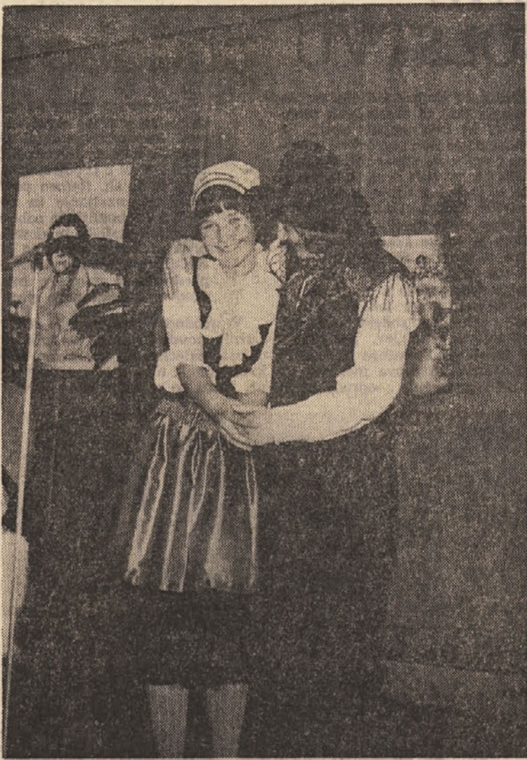
Osmi februar, slovenski kulturni praznik, so tudi na osnovni šoli njih nošah z izredno interpretacijo Prešernovih pesmi navdušili ne le njih nošah z izredno interpretacijo Prešernovih pesmi navdušili ne le svoje vrstnike, temveč tudi učitelje.