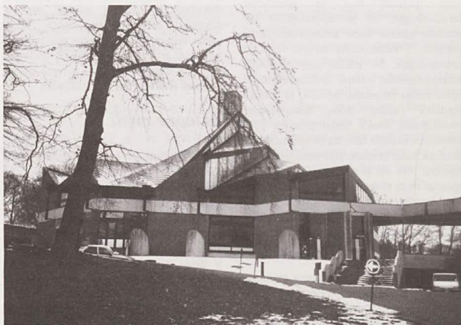
Konferenčni center