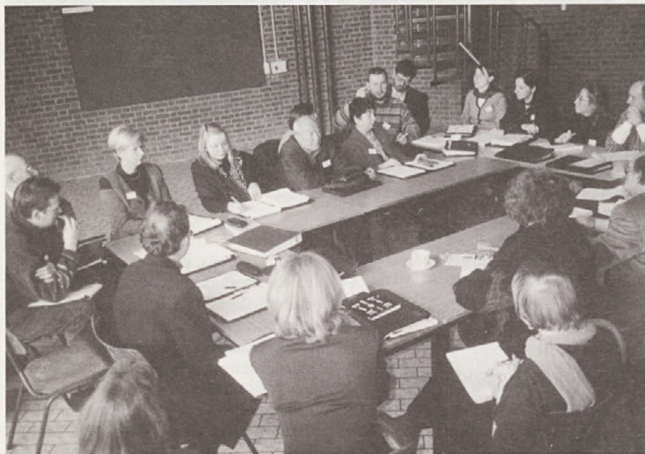
Delo v skupinah

Pénélope Theologi-Gouti pa je kot predstavnica ICOM etno-grupe predstavila projekt klasifijskih sistemov za etnografske muzeje.