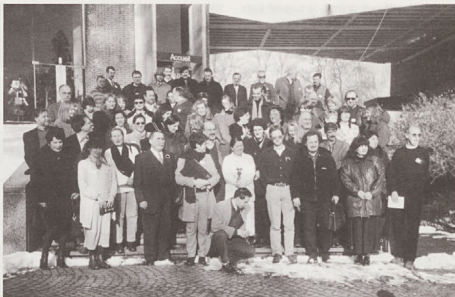
Udeleženci konference