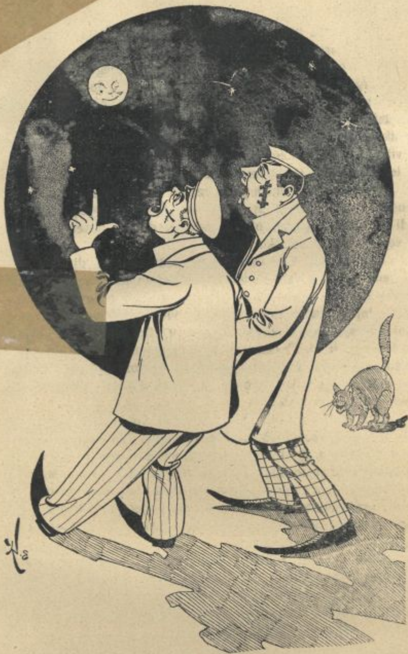
„Bumel“ nemških buršakov v Pragi.