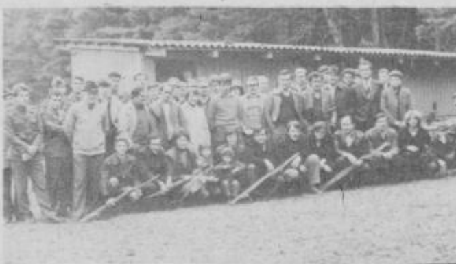
Na tekmovalju se je zbralo 74 strelcev iz 11 strelških družin.

VRSTNI RED: 1. Turnišče -L — 693 krogov, 2. Agis — 650 krogov, 3. Turnišče — II — 613 krogov, 4. Olga Meglič — 528 krogov, 5. Jože Lacko Kicar 524 krogov, 6. TGA Kidričevce 505 krogov 7. Garnizija JLA Dušan Kveder-Tomaž Ptuj — 424 kroge. —D. Papler