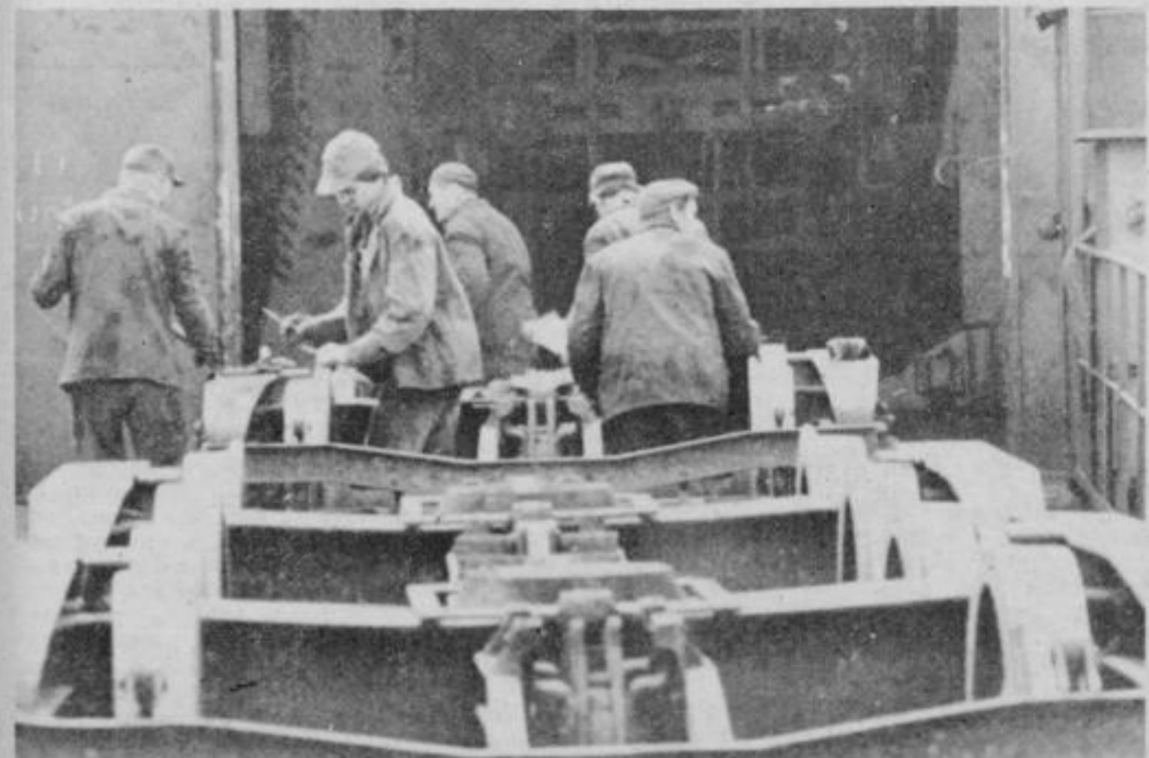
V železniških delavnicah v Ptuj