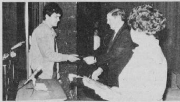
Članske izkaznice je sprejelo 16 novih članov ZK.