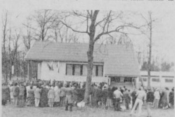
Zbrana množica Kidričanov ob novi pošti na sobotni svečanosti.