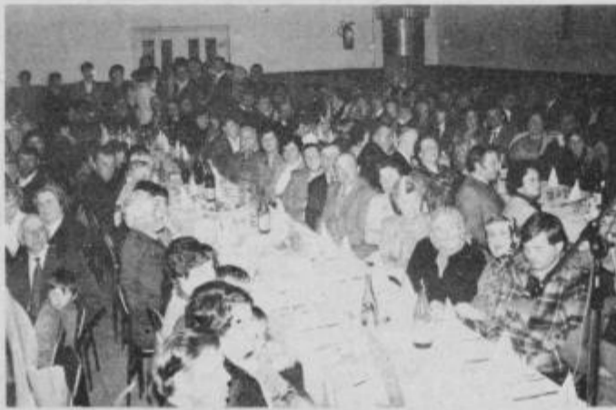
Okoli 230 vaščanov se je zbralo v kulturnem domu v Kungoti.