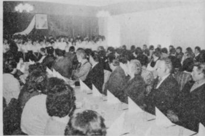
Delavci Kmetijskega kombinata Ptuj, zbrani v Narodnem domu med izvajanjem kulturnega programa učencev OŠ Olga Meglič.