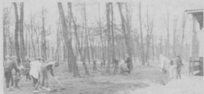
Svoj delež so prispevali tudi mladi, ki so z redkimi starejšimi posamezniki zadnja dva dni čistili okolje nove pošte.

potrebe medkrajevnega telefonske centrale, katere vrednost je nekaj nad milijon din. Tako bo še letos, predvidoma v juliju aktivirana celotna investicija, ki bo veljala 17,1 milijon din. In od kod sredstva za novo pošto v Kidričevem? Razen telefonskih naročnikov, ki združujejo sredstva po impulzih, je prispevala 1,5 milijona Samoupravna komunalna skupnost — enota za uporabo mestnega zemljišča iz Ptuj. Krajevna skupnost Kidričevo je iz sredstev samopriskpeva primaknila milijon din, levji delež pa je vložila TOZD za PTT promet iz Ptuj skupaj z območnim samoupravno interesno skupnostjo za PTT promet.