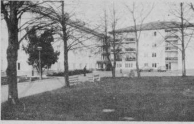
Prenovljen dom počitka „Dr. Jože Potrč“ v Poljčanah