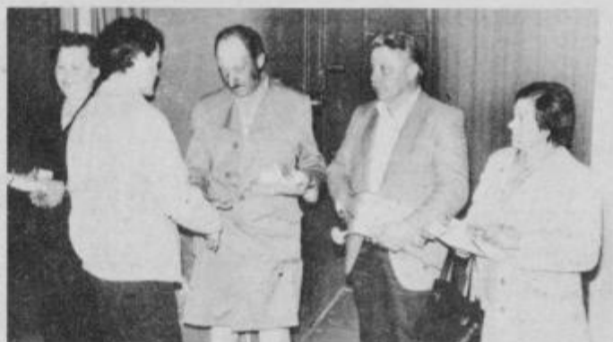
Čestitke in iskrena zahvala komunistom, ki že tri desetletja aktivno delujejo v občinski organizaciji ZKS Ormož.