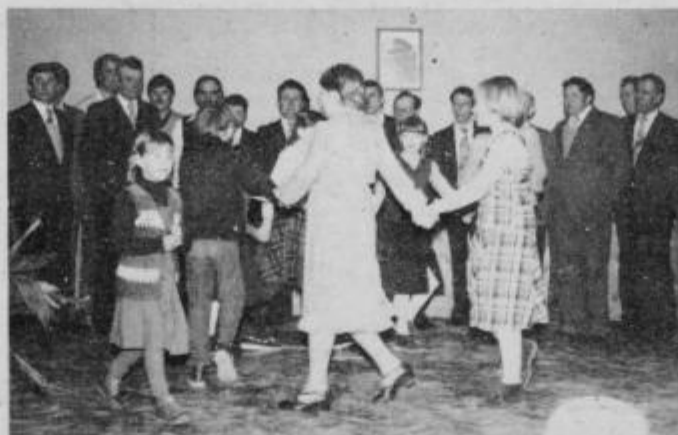
Nekdaj igra deklice na vasi.

delov ptujke občine zbrali čez 25 novih tisočakov in za silo uredili nogometno igrišče sredi gozdov pod Dončko goro. Tako prizadevnost mladih pa je lahko za vzglad mladim, ki žive v neprijetno bogatejših in razvitejših okoljih pa kljub temu ne znajo pokazati niti del take prizadevnosti in samoodpovedovanja kot mladi pri TVD Partizan Jesenica. KS Zetale.