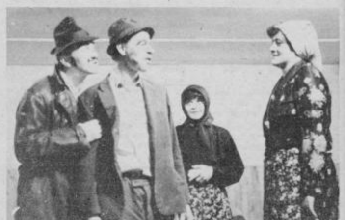
Skeč ženin in nevesta so vaščani sprejeli posebno prisrčno.

Moram na koncu še poudariti, da so si v tem času tudi uredili kletne prostore, jih ometali, da jim bo tudi ta del prostora služil za nudenje gostinskih uslug ob pridelvah. Na koncu jim lahko samo zaželimo še več takšnih in podobnih srečanj.