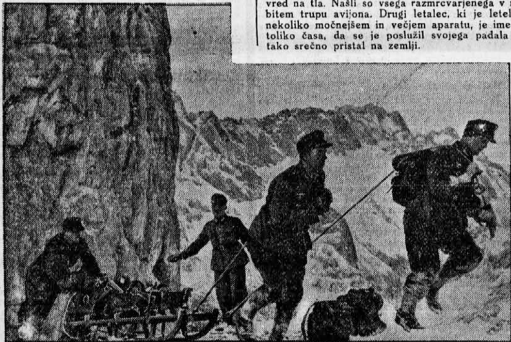
Nemška artilerija na vojaških v ajah pod grebeni gore Zugspitze

na svetu tehta 507 ton. Je to ogromen kolos, ki opravlja prometno službo na progi Čikago-San Francisko. Najtežja evropska lokomotiva je kar za tretjino lažja ter tehta 328 ton. Ta je v službi na progi Moskva-Vladivostok. Razumljivo je, da mora težnja lokomotive biti prilagojena tudi vzdržljivost železniških prog. Proga, po kateri vozi gori omenjena lokomotiva, je zgrajena izredno masivno. Na naše proge takih lokomotiv gotovo ne bi smeli spustiti. Če pa bi jo spustili, bi morala voziti čisto počasi in bi torej njena moč nič ne pomagala. Saj še kapacitete lastnih lokomotiv radi slabih prog ne moremo izrabiti!