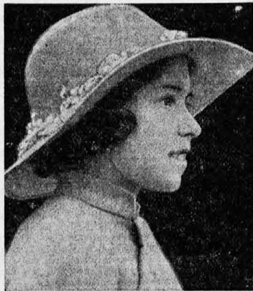
Angleška prestolonaslednica Elizabeta

V italijanskem vojnem zrakoplovstvu so nesreče prav pogoste. Sedaj poročajo o najnovejši nesreči, ki je zahtevala eno človeško žrtev, poleg tega pa sta popolnoma uničeni dve najmodernejši letali. Do nesreče je prišlo nedavno nad letališčem Bengazi. V različnem času sta se dvignila v zrak dva vojna letalca. Na nepojasnen način sta nekaj časa pozneje, ko sta letali leteli preko letališča iz