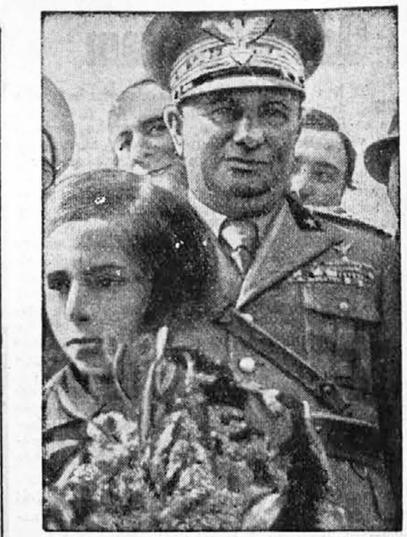
General Guzzoni, vrhovni poveljnik italijanske armade, ki je zasedla Albanijo. Pred njim deklica, ki so jo poslali, da mu izroči v zahvalo šopek cvetja.