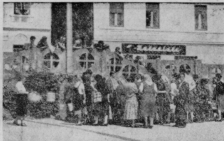
Na ptujskem trgu. Če cena ne odgovarja, kupci gredo...