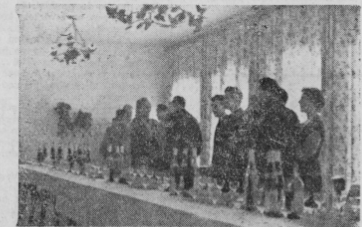
Ptujski muzej slovi po svetu že dolga leta, z njim je sedaj zaslovela tudi »GRAJSKA RESTAVRACIJA« Ko si začelite sami, z družino ali družbo razvedrila po ogledu muzeja, v prostem času ali zvečer in primernega okrepčila, vam bo najbolj ugajalo v »Grajski restavraciji«. Postrežemo vam z okusnimi jedmi in pristnimi pijačami ob zvokih naše zabavne godbe. Odično se počutijo pri nas tudi kolektivni gostje iz drugih krajev in iz domačih kolektivov ob raznih kolektivnih slovesnostih. Vabi vas uprava »GRAJSKE RESTAVRACIJE«, PTUJ

Čenim ženske, ki imajo med svojimi ušesi še kaj drugega kakor lep obraz. V. Hugo