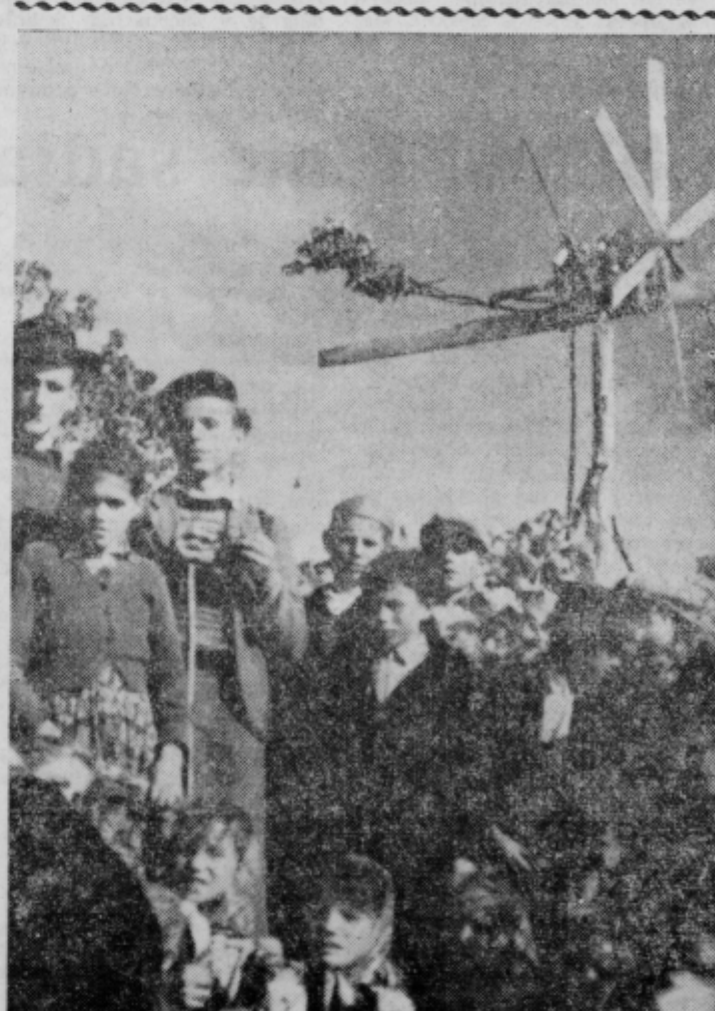
V vinogradih KG Podlehnik je le tos trgatav dolgo trajala in tudi veliko dala

Amerika izgublja prestiž predvsem zaradi svojega stališča do Vzhoda. Njihova osnovna teza je na grobo rečeno v tem, da ne priznavajo bivanja vzhodnih držav in zato se je treba proti njim bojevati, namesto da bi se sprizidali s porajanjem novega družbenega reda in skušali iz tega dejstva izveliči čimveč koristi.