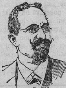
Dr. Alb. Gessmann

Tukaj podamo sliko enega najbrezobzirnejših voditeljev klerikalizma na Dunaju in sploh na Avstrijskem. Dr. Albert Gessmann je splezal na ramenah pokojnega Luegerja do visočine. Bil je minister in zdaj se splošno govori, da namerava