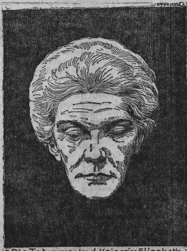
Die Totenmaske d. Kaiserin Elisabeth