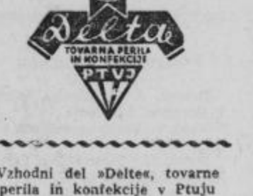
Vzhodni del »Delte«, tovarne perila in konfekcije v Ptuj

Sindikalno in mladinsko delo v tovarni se odraža zlasti ob raznih slovesnostih, ko nastopajo v točkah najmlajši člani kolektiva kot pevci, folkloristi, godci, igralci in podobno. Ob dnevu žen, ob 1. maju, ob dnevu repu-