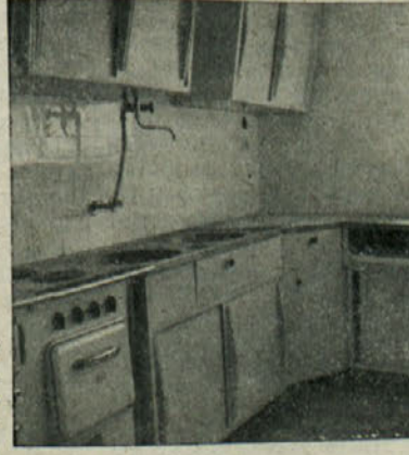
Sodobno urejena kuhinja v stanovanjski stavbi »Zidare« Kočevje

Razstavo si lahko ogledate še v soboto in nedeljo. Na železnici imate popust.