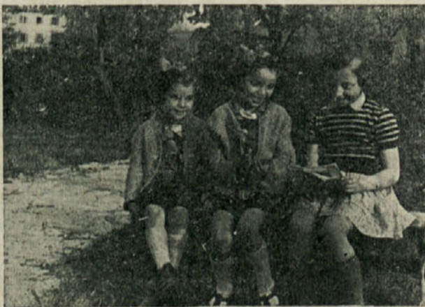
Zdrave in vesele so

Vprašujemo se, ali je bilo potrebno izpostavljati vse otroke nevarnosti, da se na vseh prihodnjih diho? Ali je bilo potrebno, da so