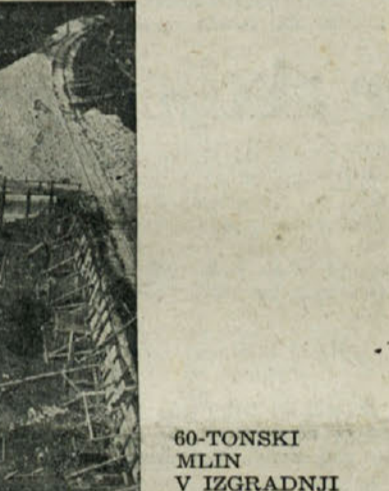
60-TONSKI MLIN V IZGRADNJI

Nov način zbiranja investicijskih sredstev v okrajne in občinske investicijske sklade bo omogočil tudi v trgovini racionalno investiranje. To investiranje bo v letošnjem letu obeleženo z napani za kulturno in higiensko postrežbo, kajti v prvi vrsti bo treba investirati sredstva za zboljšanje trgovinske opreme, sodobno ureditev prodajal in skladišč, zlasti v trgovinah z živili.