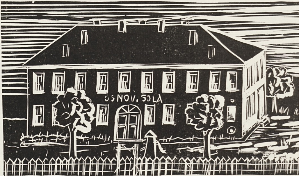
Narisa: Ljubo Kampl, 7. razred

Največja pridobitev za našo šolo je šolska kuhinja, v kateri dobiva toplo malico tri četrtine učencev.