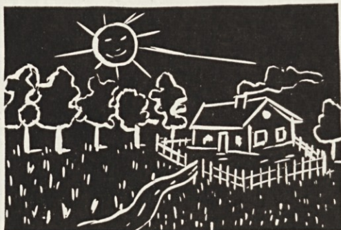
Narisala: Nada Stumberger, 8. razred