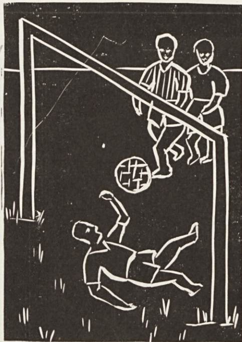
Narisala: Ljubica Maroh, 8. razred

pa smo na gmajni zagledali buldožer, ki je vlekel za seboj velikanski plug. Noč in dan je škrtal po gmajni in obračal brazde.