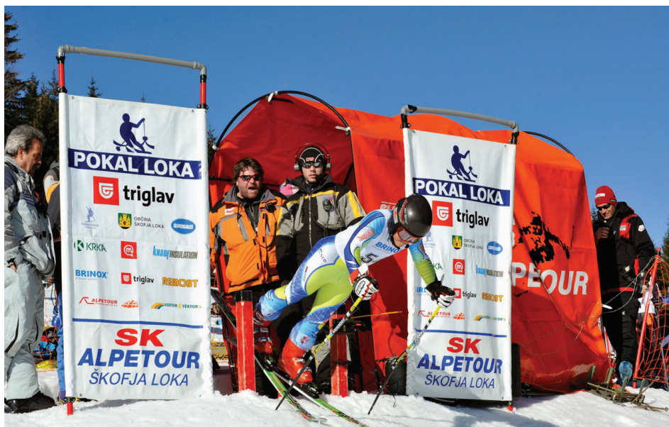
Pravo tekmovalno vzdušje kot je na tekmah svetovnega pokala.

V prvih letih tekmovanja nismo smeli izvesti vsako leto, ker je mednarodna smučarska zveza zavirala pre zgodnje usmerjanje v tekmovalni šport, zato imamo v 42. letih le 40 tekem. Nikoli pa tekmovanje ni odpadlo, le leta 1995 smo izvedli samo eno tekmo. 27-krat smo se zbrali na Starem vrhu, 11-krat nas je reševala Soriška planina, po enkrat smo šli na Črni Vrh nad Cerknim in v Kranjsko Goro. Po letu 2012 na tekmovanju sodelujejo otroci stari 13 in 14 let v mlajši ter 15 in 16 let v starejši kategoriji. Po novem naj bi se otroška tekmovanja preimenovala v tekmovanja za mlade.