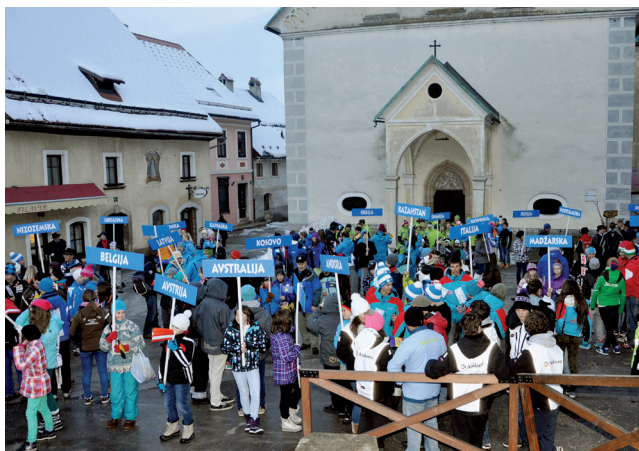
Tekmovalci se pripravljajo na sprevod čez Mestni trg 2013, sodelovali so predstavniki iz 33 držav.