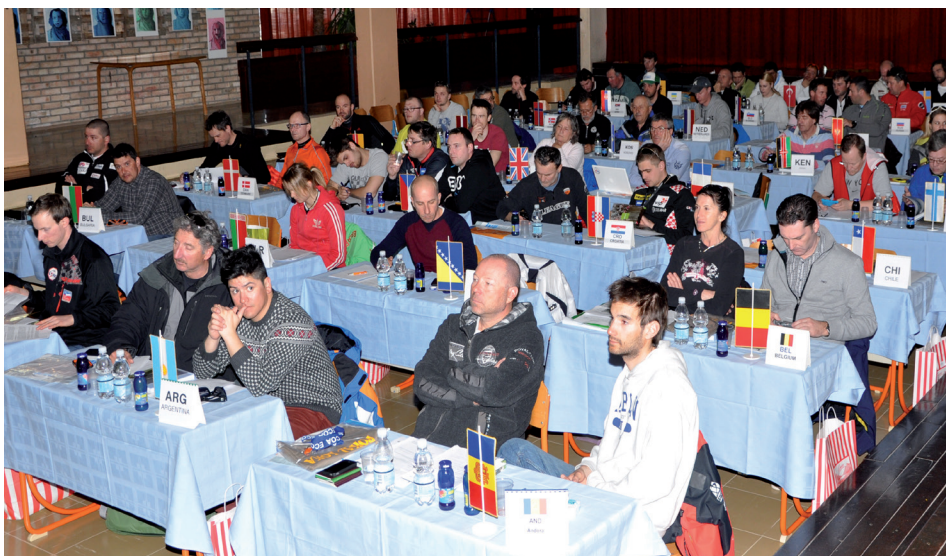
Predstavniki držav udeleženci na sestanku vodij ekip na predvečer tekmovanja.

Skupina več kot stotih smučarskih navdušencev, ki se vsako leto zbere v sredini februarja, in manjši krog organizatorjev, ki za prireditev skrbijo celo leto, bo kljub težavnijim razmeram nadaljevala s svojim projektom, v korist domačega kraja in slovenskega smučanja.