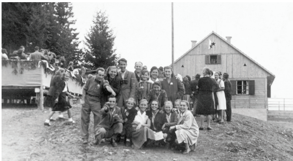
Leta 1950 so loški smučarski entuziasti s prostovoljnim delom zgradili kočo na Starem vrhu.

Izgradnja žičnic leta 1970, naložba podjetja Transturist, je ena od prelomnic, ki so zaznamovale in vplivale na razvoj loškega smučanja. Koča je ostala v lasti smučarjev do leta 1973, ko jo je odkupilo podjetje Transturist.