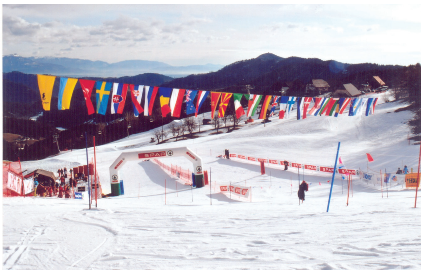
Stari vrh – prizorišče tekmovanj za Pokal Loka.

»Zgodovina smučarstva v našem Sokolu je zgodovina smučarstva v Sloveniji en miniature. Po trdih bojih v Karpatih, v zimi 1914/15, je hitela Avstrija organizirat vojaške smučarske oddelke za vojno z Italijo že koncem avgusta 1915. Začetkom zime je že postavila na bojišče precej močne oddelke, izvežbane v takrat edino zveličavni tehniki Zdarskega v Visokih Turah. Veliko število nas starih smučarskih bajt, takrat robotov alpskih polkov, se je vrnilo po vojni domov in prineslo s seboj kot edini prijetni spomin tako neizrečeno težkih dni v tirolskih Alpah in kot edini dobiček – nekaj smučarske izvežbanosti, zraven pa nič koliko navdušenja.«