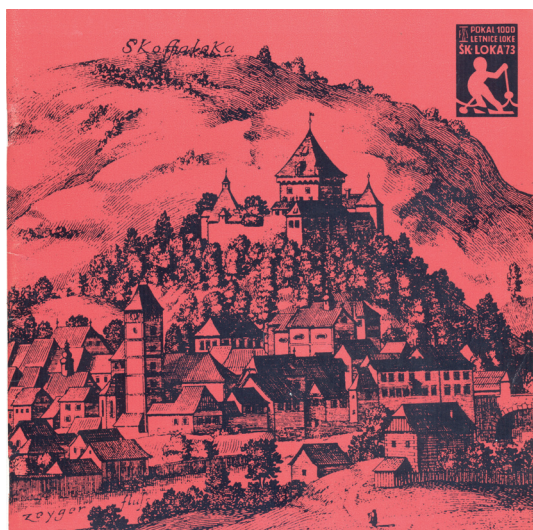
Naslovna stran biltena Pokal tisočletnice Loke iz leta 1973, oblikovanje Peter Pokorn st.

Sestajajo se vsako leto na eni od naštetih lokacij, si izmenjujejo izkušnje in pripravljajo izhodišča za enoten nastop v okviru mednarodne smučarske zveze FIS.