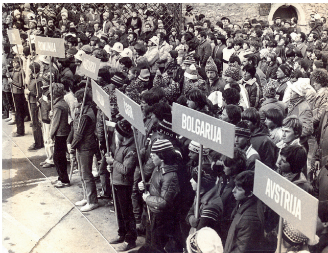
Odprtje tekmovanja Pokal Loka 1976 pred stavbo današnje Upravne enote Škofja Loka.