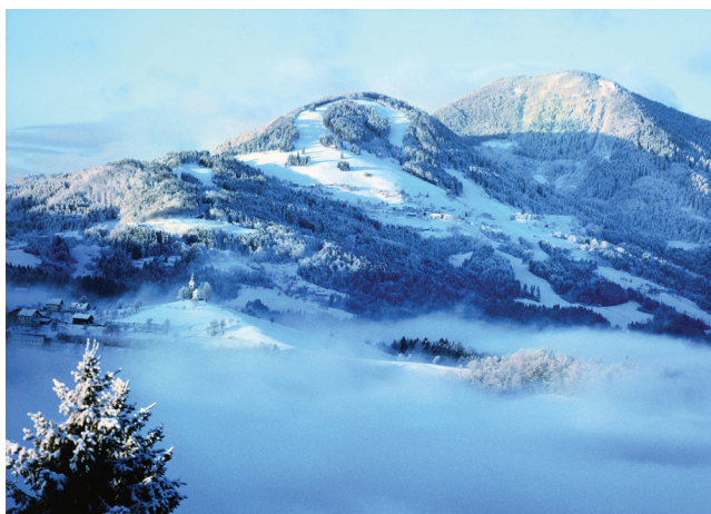
Stari vrh je čudovit naravni stadion za organizacijo tekem Pokala Loka.