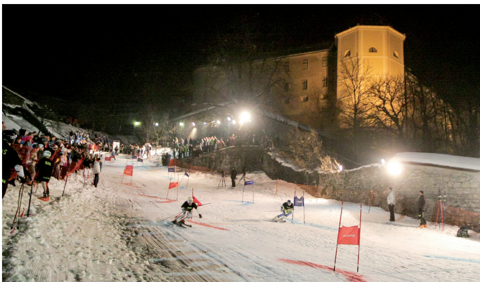
Otvoritev tekmovanj vsako leto popestri atraktivni nočni paralelni slalom pod Loškim gradom.

Pokal Loka je na smučarskem zemljevidu dobil svoje mesto in z njim naš kraj. Želja organizatorjev, ki brez kakršnihkoli nadomestil iz leta v leto dogodek