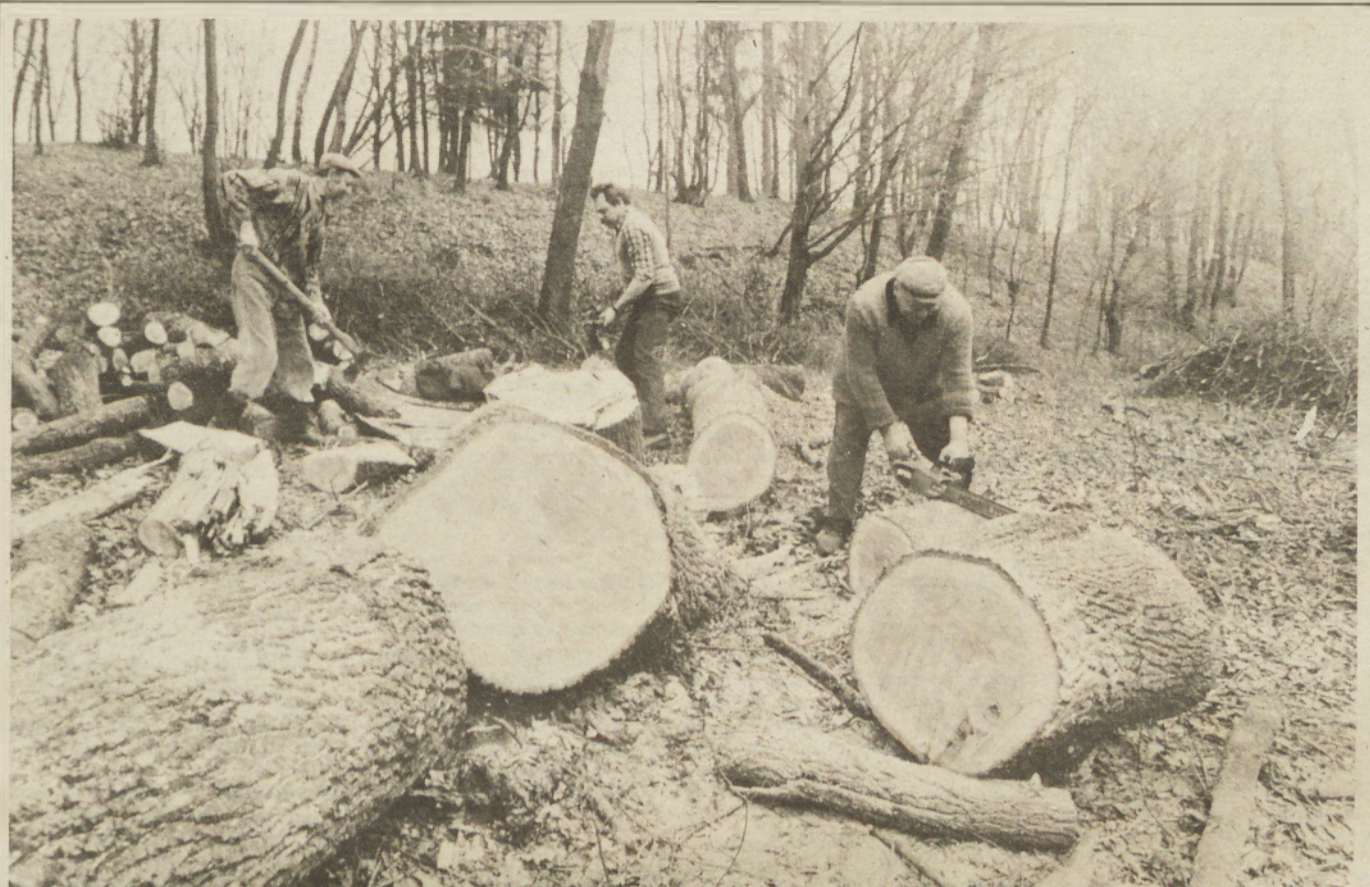
Medtem ko so že stekla prva dela na poljih in travnikih, tudi gozdarji ne mirujejo. Drevje je treba posekati, ko vegetacija miruje, saj pravijo, da takšen les tudi bolj drži. Tule hrastovina bo bojda za sode, saj se vedno drži tisto znano pravilo, da v hrastovih sodih dozoreva najboljšje vino.

NAJBOLJ VROČ JE SKUHAN LASTNI VO-LILNI GOLAŽ — Tak je naslov današnje aktualne teme: Volitve 89. V njej skušamo osvetliti nekatere dileme, ki se pojavljajo v zvezi z bližnjimi volitvami za člana predsedstva SFRJ iz SR Slovenije.