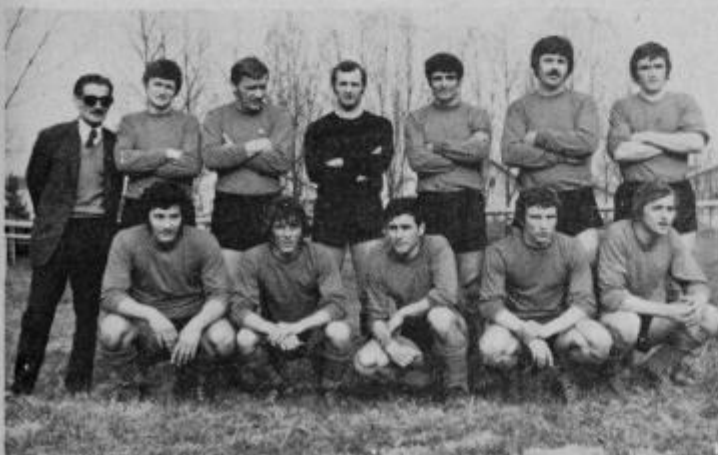
Vodstvo Osankarice pred pričetkom v novi ligi