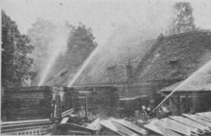
Gašenje „požara“ na GP Ograd