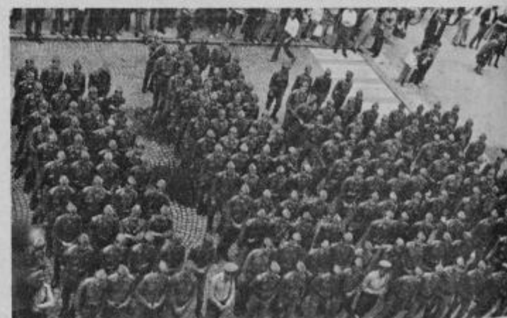
Vojaki iz ptujске in Slov. Bistriške garnizije so napolnili trg mladinskih delovnih brigad. Na sliki je vidna samo desna polovica.