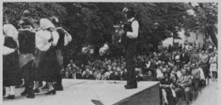
Udeleženci srečanja ukradenih otrok na ptujskem gradu

Največja atrakcija na dnevu gasilcev v Ormožu je bilo spuščanje ljudi po drči iz grajskega stolpa. Več o prireditvi poročamo na 5. strani.