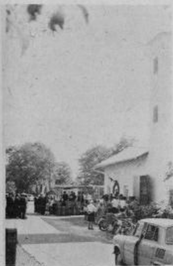
Gasilski dom v Markovcih odprt