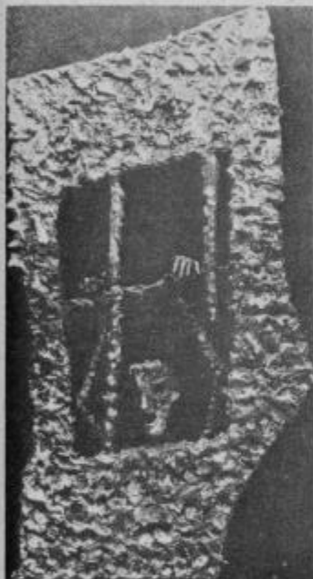
Plaketa: „Obup – upanja“