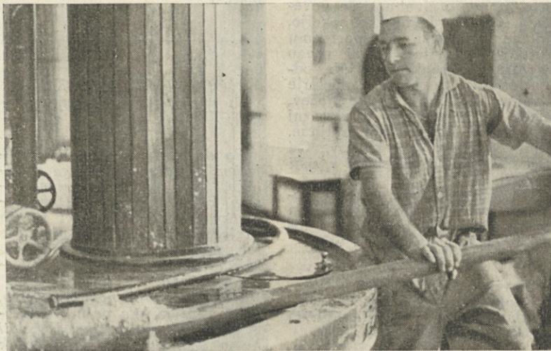
Preden bo mlinar papirne snovi začel z mletjem, se mora prepričati, če snov lepo kroži v koritu holandskega mlina. Po mletju jo bo spustil v mešalne kadi in od tu naprej na papirni stroj

Upajmo, da bo uredniški odbor zaupanje centralnega delavskega sveta opravičil z marljivim delom za napredek in še večjo pestrost našega glasila.