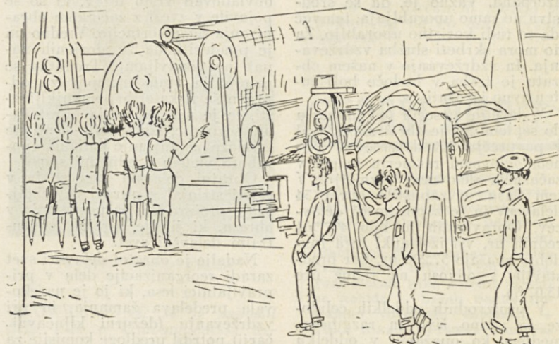
Tudi eden izmed vzrokov, da odstotek izmeta stalno narašča

Za pomoč pri montaži težkih delov bo služilo dvigalo, ki je bilo pravkar nabavljeno pri Litostroju v Ljubljani. S tem bo prihranjenega veliko truda in skrajšano namudno delo. V kolikor ne bo prehud mrz oviral del, upamo, da bo belilnica stekla pomladi prihodnjega leta. Pri.