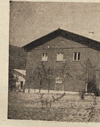
Upravni prostor KGP Kočevje

Kmetijsko gozdarsko posestvo Kočevje sodi med največja podjetja na Kočevskem. Do 1. maja 1952 je delovalo več samostojnih podjetij, ki so se omenjenega dne združila in sicer: Zivinorejsko gospodarstvo Stara cerkev, Državno posestvo Črmošnjice, Gozdno gospodarstvo Kočevje, Kmetijska strojna služba Breg in Trgovina državnih posestev Ljubljana. Podjetja so se združila v eno podjetje, ki je dobilo naziv: Kmetijsko gozdarsko posestvo Kočevje. Prvega julija 1954. leta je prišlo v sestav KGP še Lesno industrijsko podjetje Kočevje. S tem je bila organizacija KGP končana.