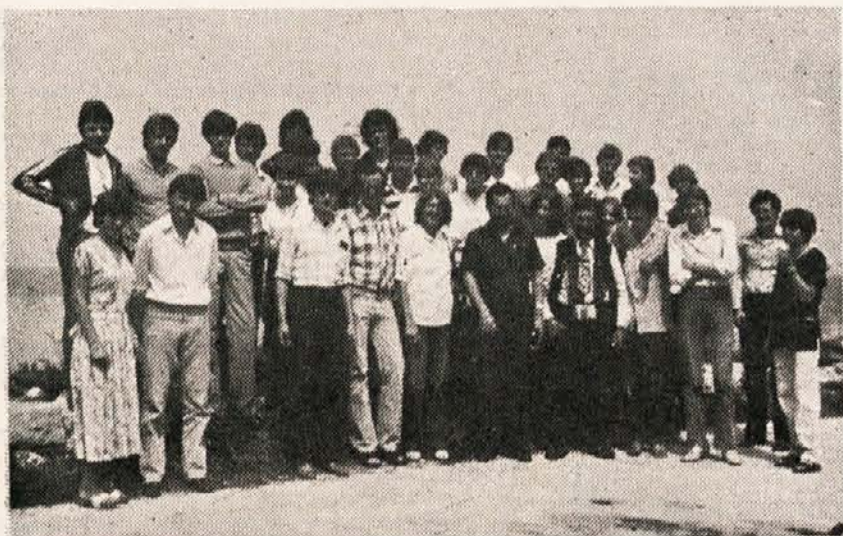
Slovenski maturanti v Beogradu